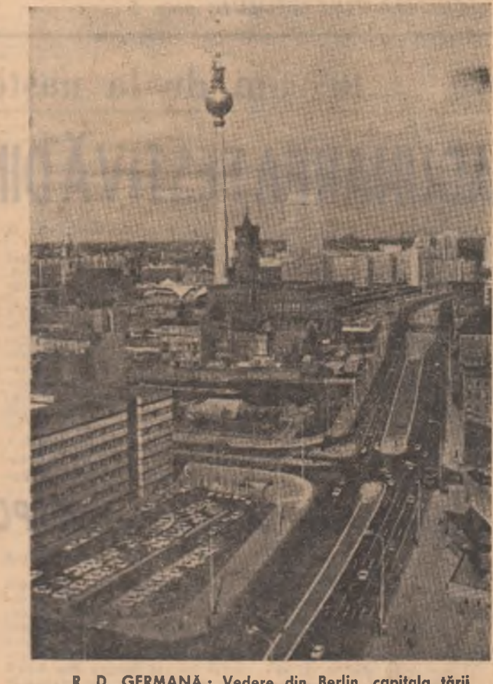
R. D. GERMANĂ: Vedere din Berlin, capitala țării

Mihail Suslov, membru al Biroului Politic, secretar al C.C. al P.C.U.S., a prezentat un raport în care a reliefat semnificația aniversării, a înfățișat principalele aspecte ale muncii constructive desfășurate de poporul sovietic, subliniind îndeplinirea cu succes a programului trasat de cel de-al XXIV-lea Congres al P.C.U.S. Vorbitorul s-a referit, de asemenea, la politica externă a U.R.S.S., la o serie de probleme ale vieții internaționale.