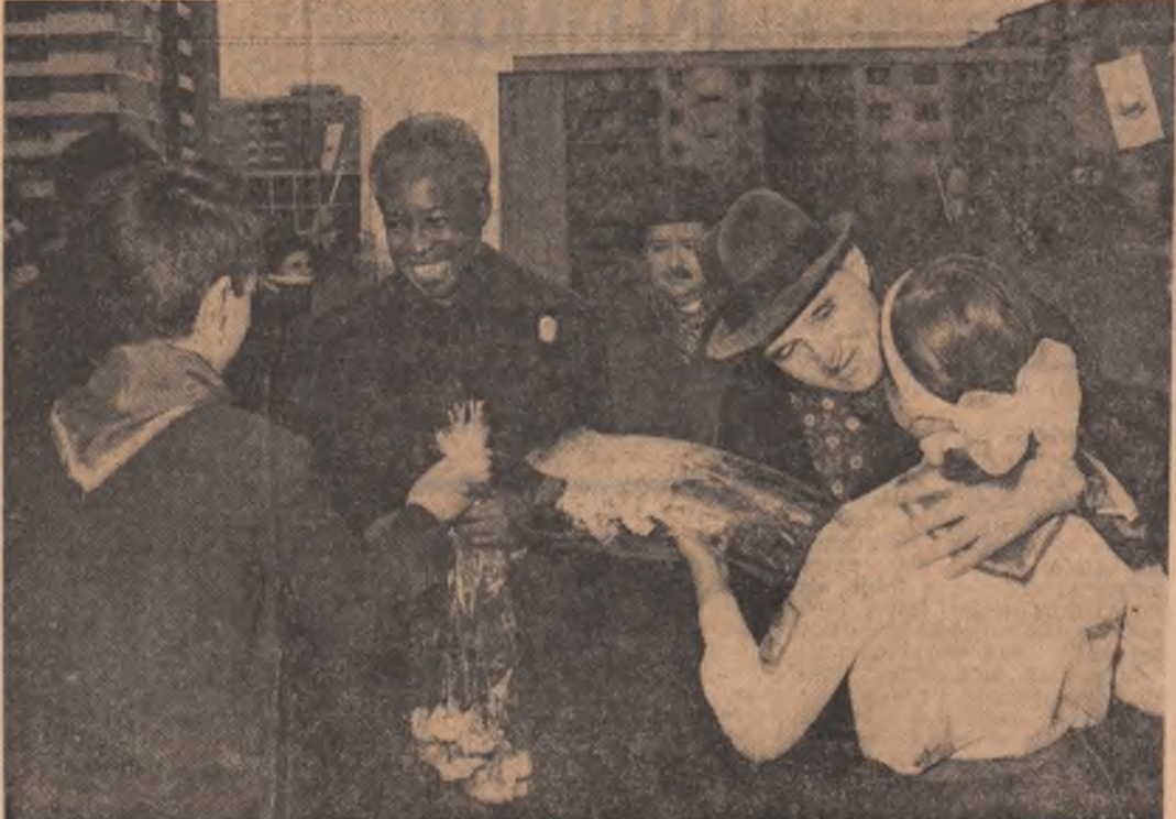
În cartierul Drumul Taberei