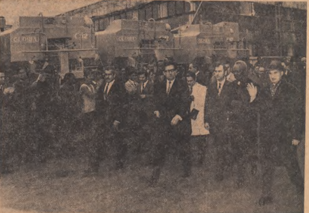
La Uzina „Semănătoarea”