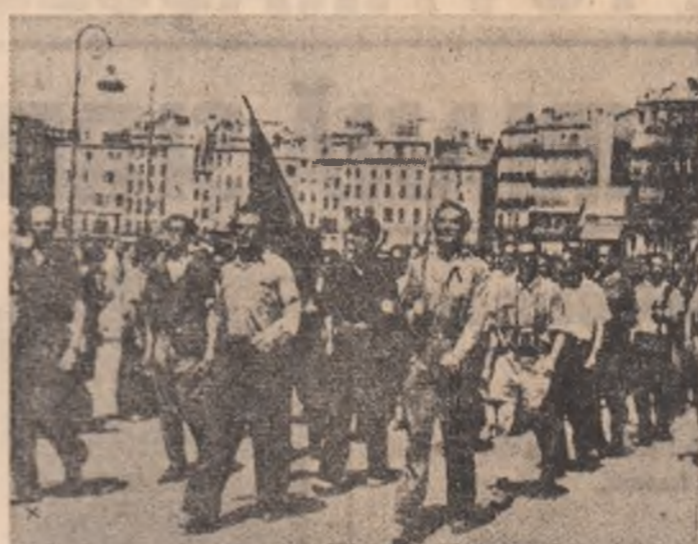
Luptători români în rîndul partizanilor francezi, la Marsilia (august 1944)