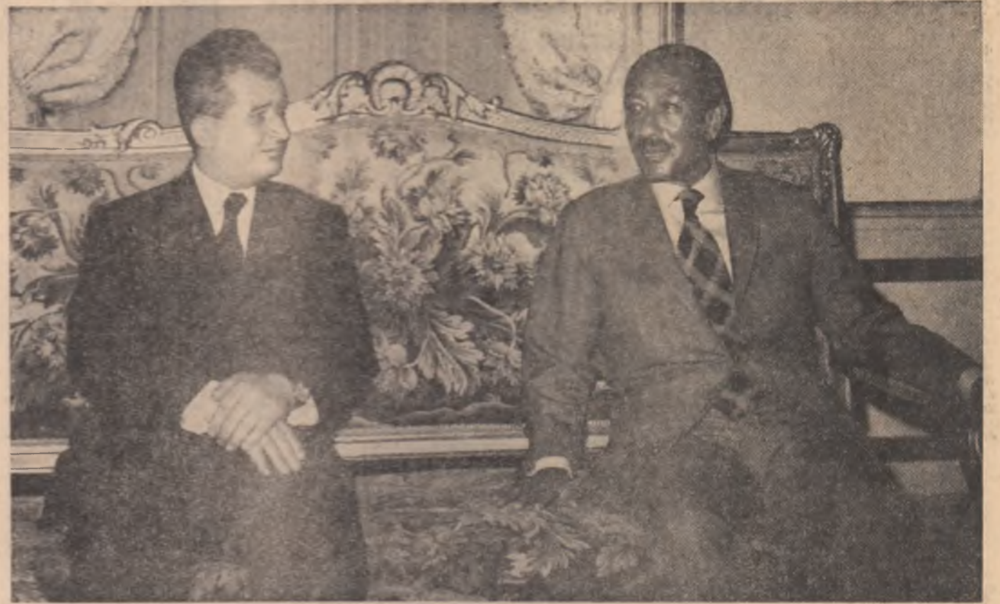
În timpul convorbirilor între președinții Nicolae Ceaușescu și Anwar El Sadat

În timpul dineului, cei doi președinți au rostit toasturi.