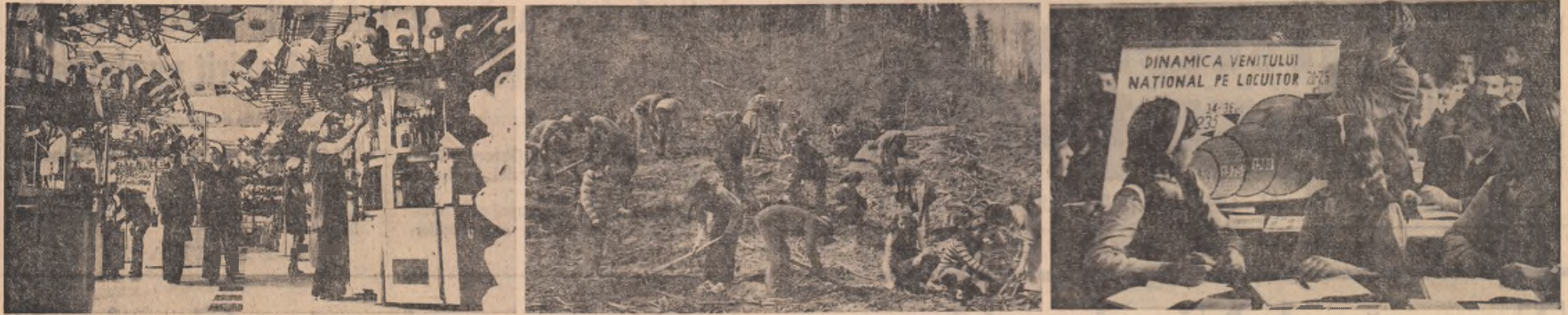
Intreaga activitate a organizatiilor U.T.C. se desfășoară în această perioadă sub semnul pregătirii pentru întimpinarea Congresului al X-lea al U.T.C. și a celei de X-a Conferințe a U.A.S.C.R. cu noi succese în toate domeniile. Imaginile de mai sus consemnează momente sugestive ale ac-