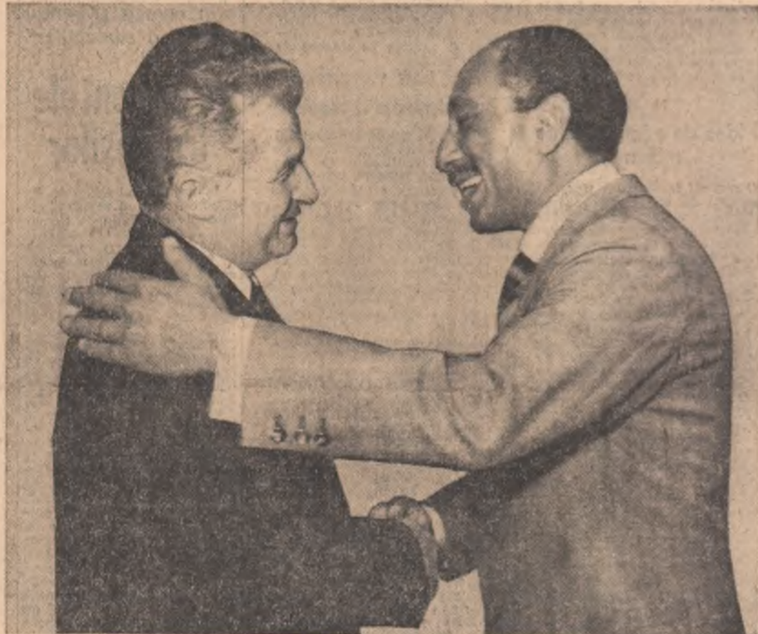
Pe aeroportul din Cairo

DAMASC 25 — Corespondentul Agerpres, Crăciun Ionescu, transmite: în dimineața zilei de 25 aprilie, tovarășul Nicolae Ceaușescu, secretar general al Partidului Comunist Român, președintele Republicii Socialiste România, care a întreprins o vizită de prietenie în Republica Arabă Siriană, la invitația președintelui Hafez El-Assad, a părăsit Damascul, plecând spre Cairo.