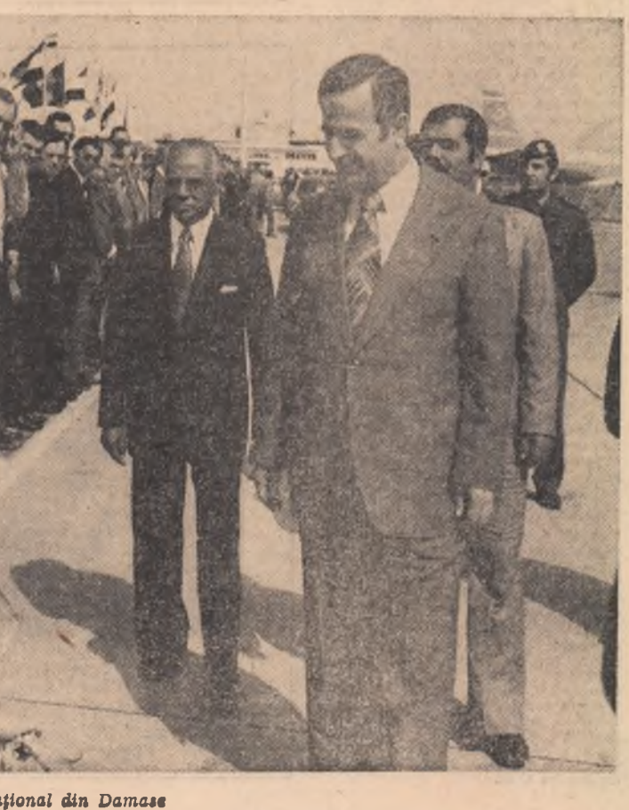
Pe aeroportul internațional din Damasc