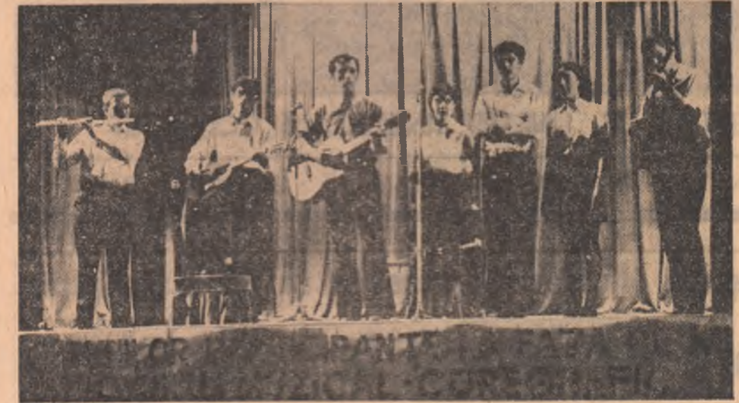
Grupul vocal-instrumental al Liceului „I. L. Caragiale” în timpul desfășurării concursului.