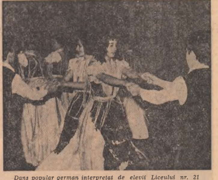
Dans popular german interpretat de elevii Liceului nr. 21.