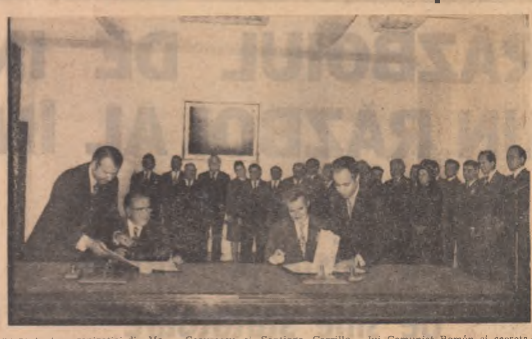
Luni la amiază, la sediul Comitetului Central al Partidului Comunist Român, a avut loc semnarea Comunicatului comun...