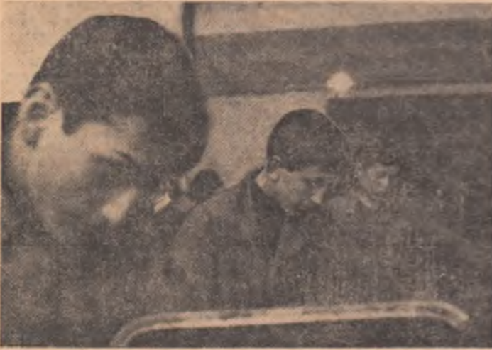
Pregătirea practică a viitorilor mineri începe din atelierul școlii.