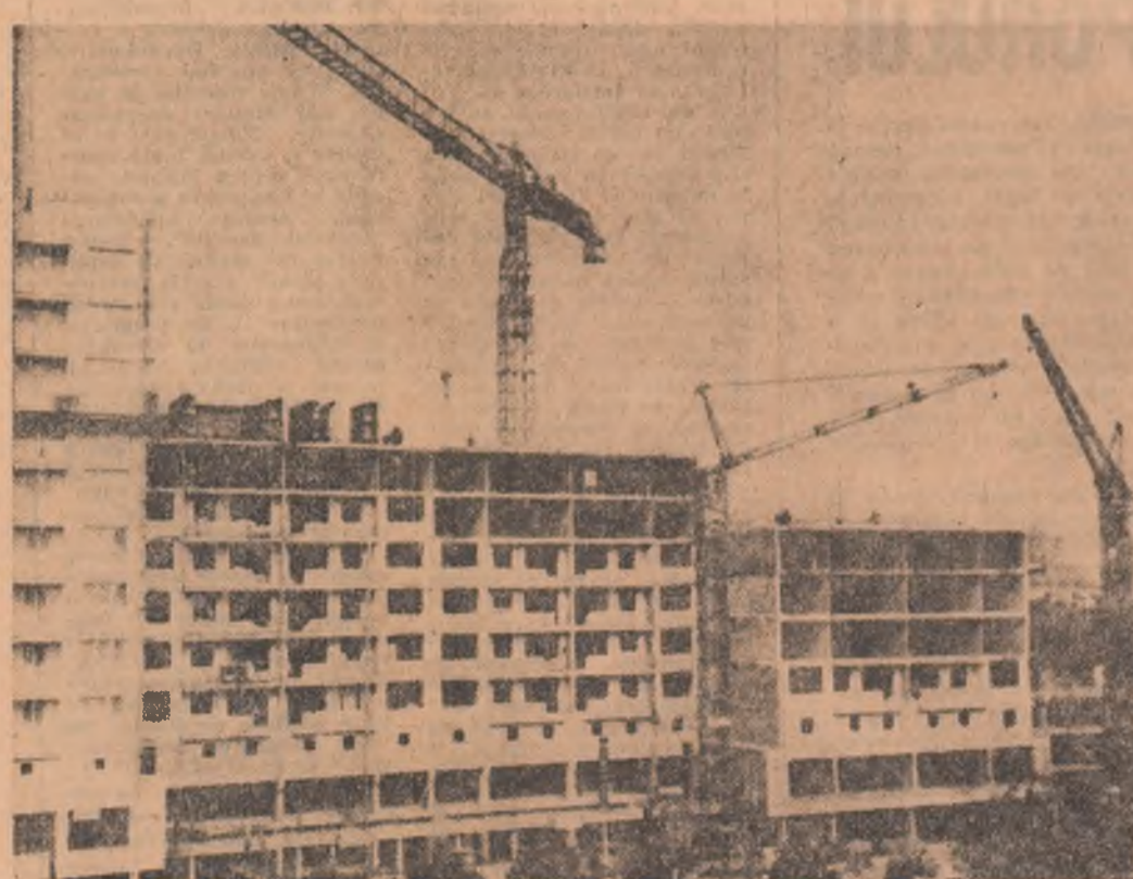
Hunedoara îmbracă haine noi