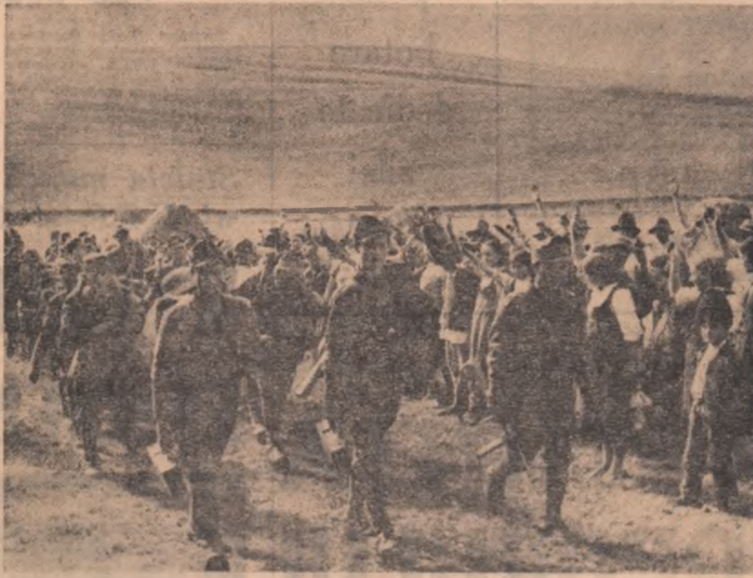
Trupe eliberatoare din cadrul Armatei a 4-a române primite cu entuziasm de populația unui sat din apropierea orașului Tg. Mureș.