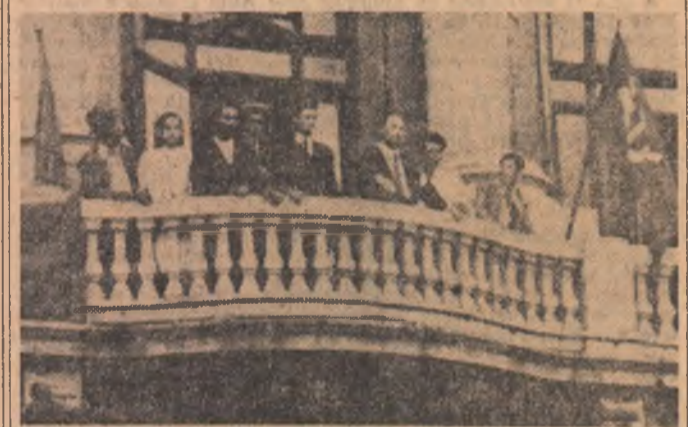
Aspect de la mitingul organizat în București, la 30 august 1944, cu prilejul victoriei însurecției și al sosirii trupelor sovietice. În balconul-tribună, tînărul comunist Nicolae Ceaușescu împreună cu alți conducători ai P.C.R.