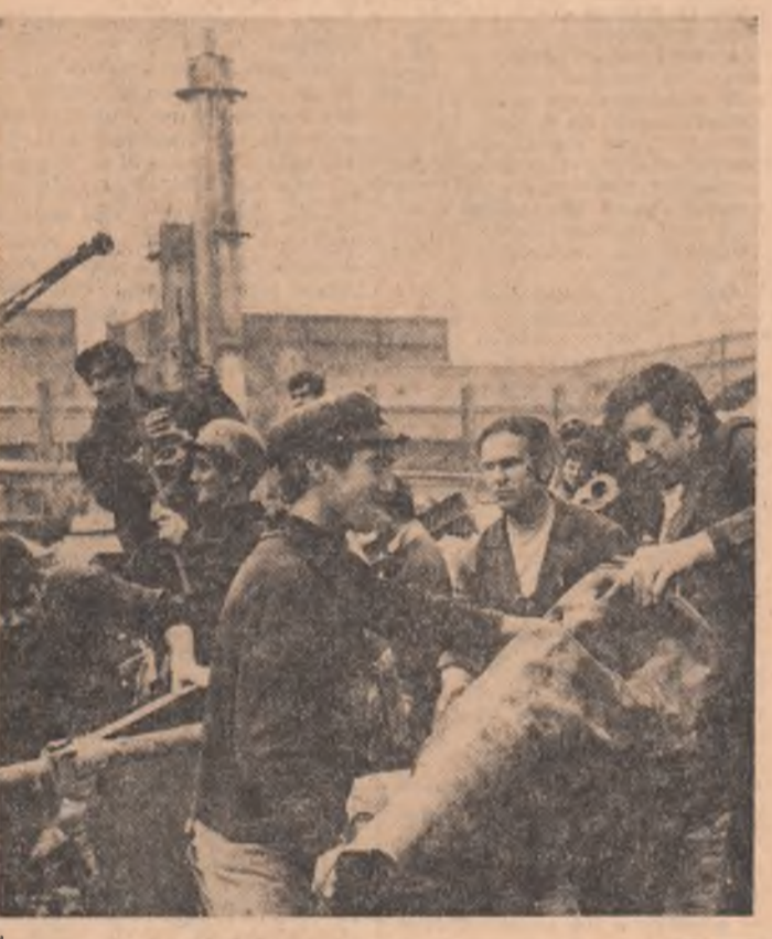
Imaginea de mai sus poate fi întâlnită frecvent în curtea întreprinderii „Progresul” din Brăila. Datorită acțiunilor de muncă patrioțică inițiate de uteciști au fost colectate până acum câteva sute de tone de metale vechi, care au luat drumul tot către uzinaria întreprinderii lor.

Aceleași preocupări le avem și pentru organizațiile U.T.C. din mediul rural. Și aici inițiativele au început prindând viață. „Pământul nostru poate să producă mai mult” este doar un exemplu. O dovadă grăitoare o constituie și amenajarea santierelor locale de muncă patrioțică de la Ciurani, Gorgota, Gherghita, unde sute de tineri muncesc cu elan pentru a reda