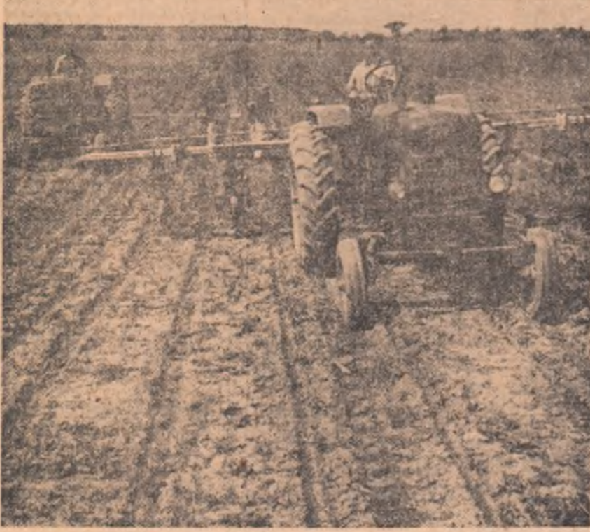
Întreținerea culturilor — lucrarea la ordinea zilei mecanizatorilor și țărani cooperatori trebuie să-i acorde mazărimă atenție — se află în plină desfășurare