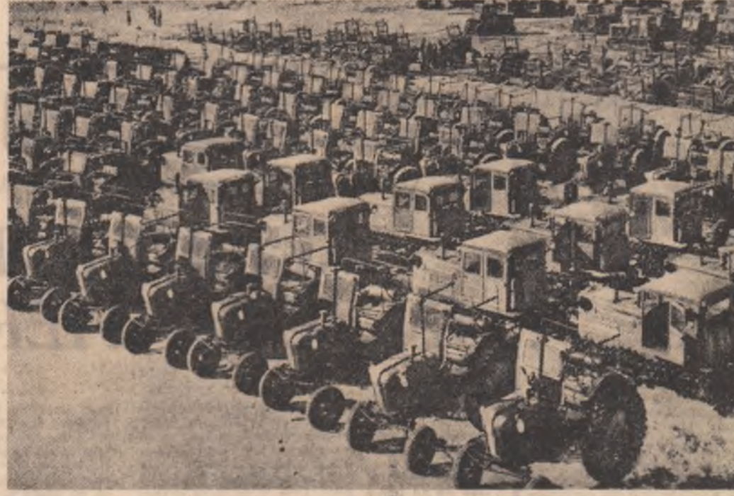
R. P. D. COREANĂ. — Aspect de pe rampa de produse finite a Uzinei de tractoare din Keumseung