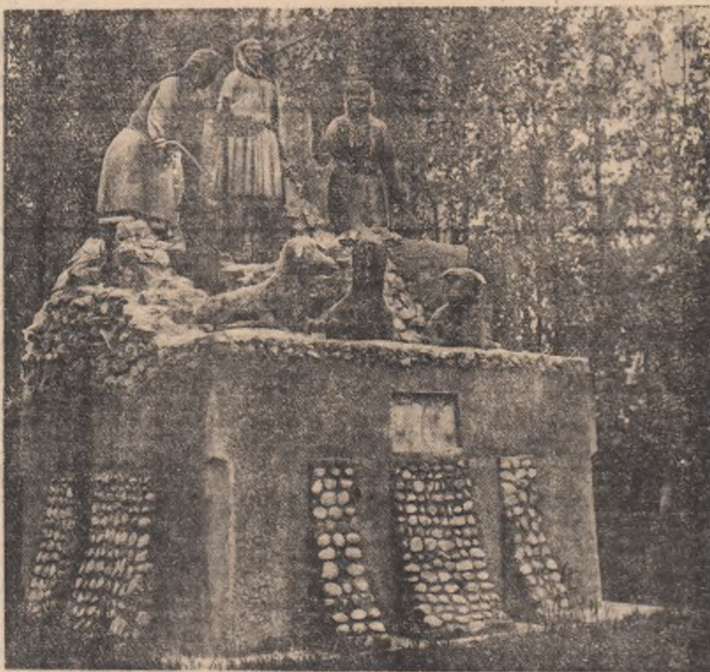
Grup statuar legendar — comuna Goicea Mare, Dolj