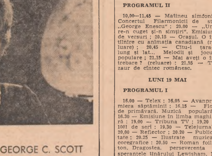
Susannah York și George C. Scott