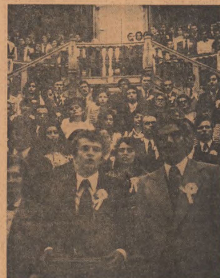
Moment solemn la rostirea jurămîntului promoției 100

Colectivele de oameni ai muncii din unitățile economice ale sectorului I din municipiul București, au îndeplinit, la 15 mai, prevederile planului cincinal. Anunțînd acest succes într-o telegramă adresată tovarășului NICOLAE CEAUȘESCU, secretar general al partidului, președintele Republicii Socialiste România, de către activul de partid al sectorului se spune: „Acum, în aceste clipe de înălțătoare și legitimă mîndrie, ne exprimăm deosebită recunoștință pentru sprijinul și prețioasele indicații date cu ocazia vizitelor dumneavoastră în difertele unități și instituții ale sectorului nostru și vă asigurăm, mult iubite tovarășe secretar general, că oamenii muncii nu-și vor precupeți forțele pentru punerea în valoare a întregului potențial material și uman de care dispun, pentru a face să crească nelncetat modesta noastră contribuție la progresul general al patriei, în vederea edificării societății socialiste multilateral dezvoltate pe pămîntul României.