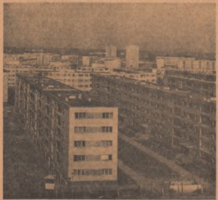
Din noile construcții ale Timișoarei

Tinerii întîmpină Congresul al X-lea al U.T.C. și Conferința a X-a a U.A.S.C.R.