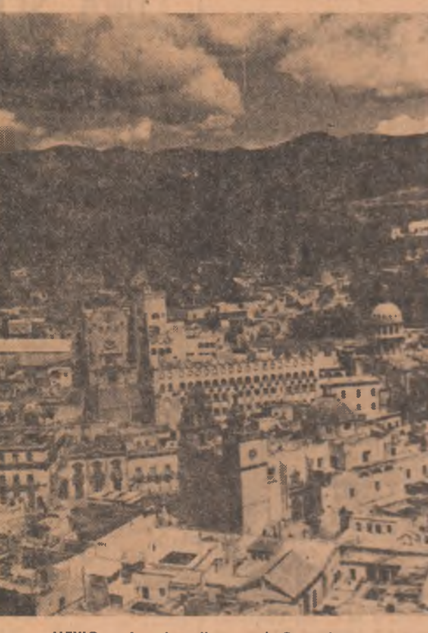
MEXIC. — Imagine din orașul Guanajuato