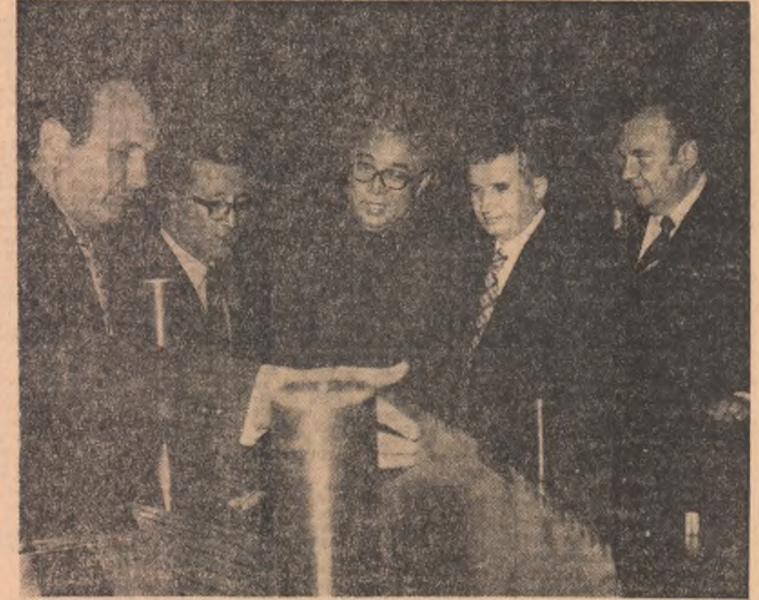
Vizitarea interesului pentru realizările colectivului întreprinderii de mașini grele