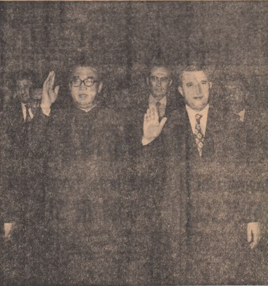
La întreprinderea „Electronica”

Pretutindeni — în întreprinderile vizitate, pe marile magistrale ale noilor cartiere, de-a lungul întregului traseu străbătut de coloana oficială — cei doi președinți au fost întîmpinați cu fiori roșii ale prieteniei, cu gesturi emoționante, din adîncul inimii, de mii și mii de oameni ai muncii din Capitală, care au exprimat astfel sentimentele de înaltă prețuire ale întregului nostru popor față de prietenia și conlucrarea frățască româno-coreeană. (Agerpres)