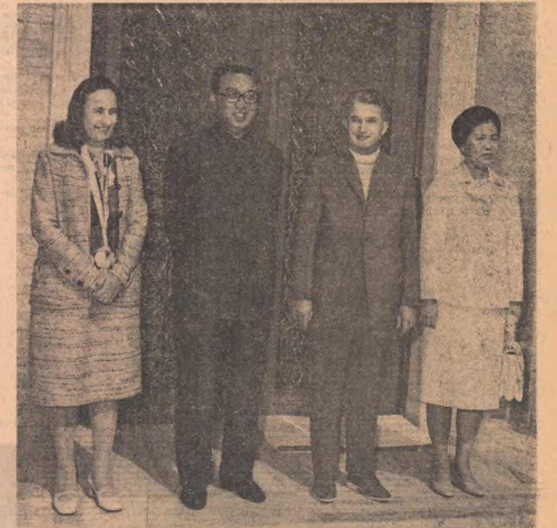
Tovarășul Nicolae Ceaușescu și tovarășa Elena Ceaușescu s-au reîntîlnit, duminică, cu tovarășul Kim Ir Sen și tovarășa Kim Sâng E, la Snagov.