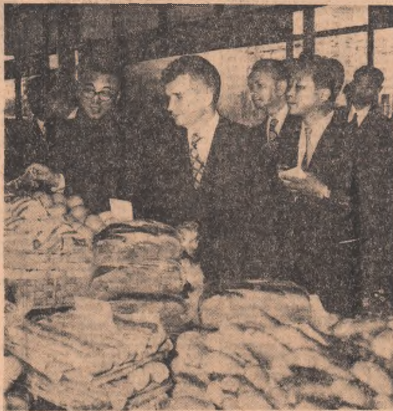
Se vizitează o unitate comercială din cartierul Titan