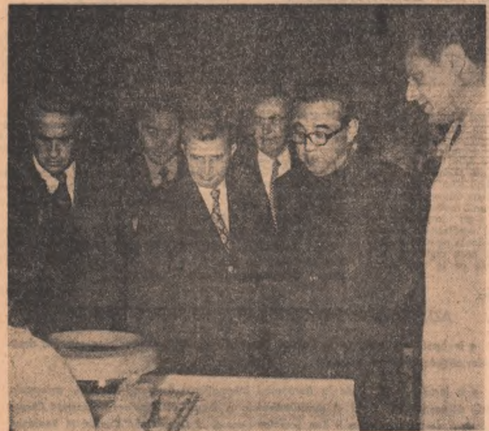
Pe platforma Pipera, la întreprinderea de calculatoare