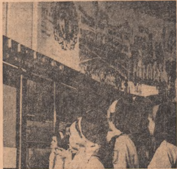
Citii în numărul următor al ziarului prima parte a serialului nostru dedicat avocării prin intermediul măturilor cuprinse în expoziție a drumului de înfăptuire a primei uniri politice a Țărilor Române de către Mihai Viteazul.

Expoziție dedicată primei uniri a Țărilor Române sub Mihai Viteazul