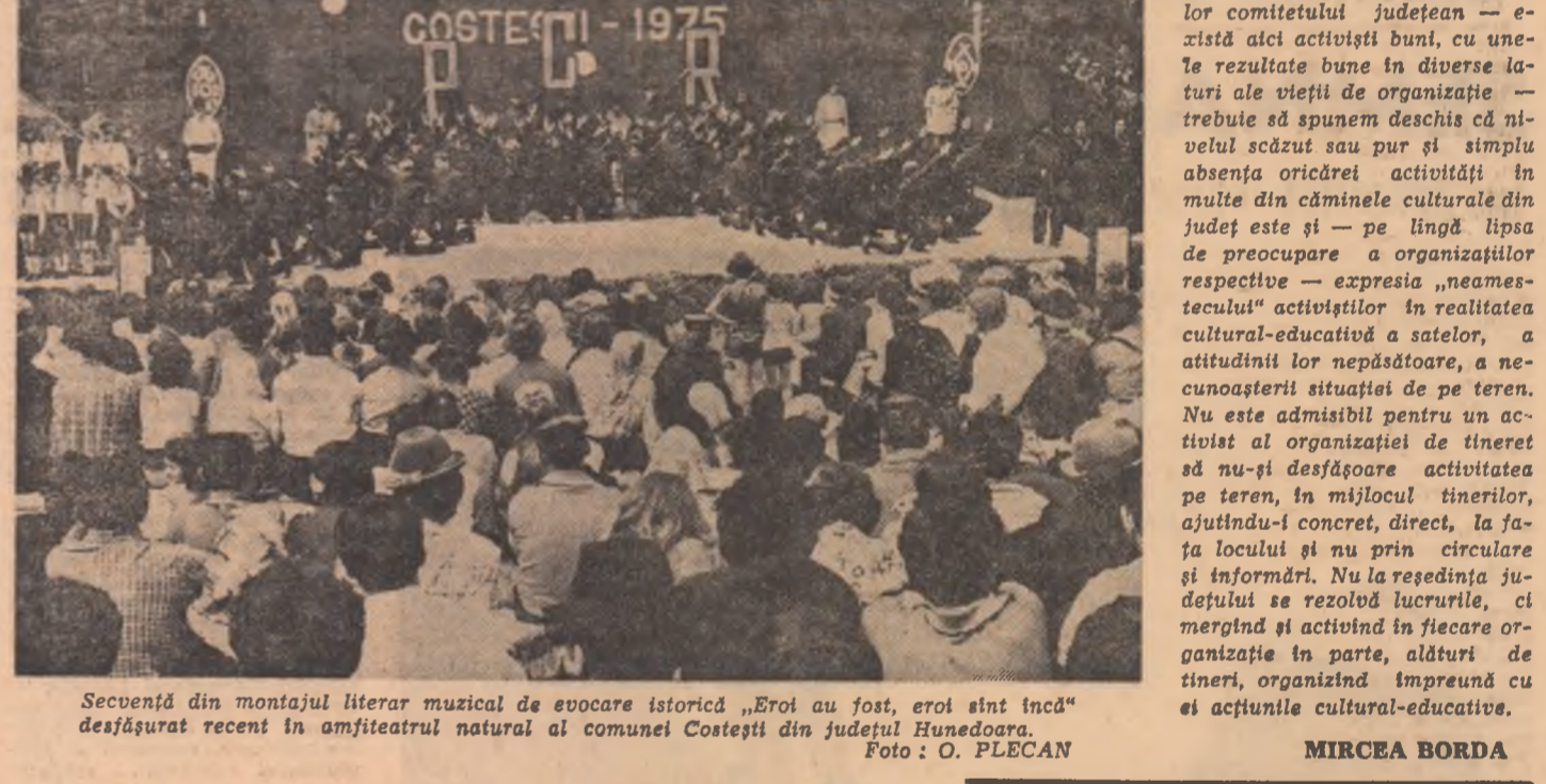
Secvență din montajul literar muzical de evocare istorică „Eroi au fost, eroi sînt încă” desfășurat recent în amfiteatrul natural al comunei Costești din județul Hunedoara.