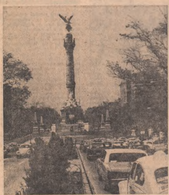
CIUDAD DE MEXICO — Monumentul Independenței

Un progres substanțial s-a obținut în redactarea textului privind cooperarea dintre statele participante în domeniul umanitar. În acest sens, reprezentanții statelor participante au convenit înscrierea în documentul pe care îl pregătesc a unor prevederi care să conducă la întărirea relațiilor prietenești și a încrederii între popoare, la continuarea eforturilor de cooperare în acest domeniu. Pornindu-se de la ideea că toate problemele umanitare trebuie să fie reglementate de către statele interesate în conștientă reciproc acceptabilă, participanții s-au pronunțat pentru încheierea de acorduri și aranjamente care să faciliteze extinderea contactelor între instituții, organizații guvernamentale și neguvernamentale, asociații, organizații de reuniuni și delegații ale delegațiilor, grupurilor și persoanelor individuale, fie în scopuri profesionale sau al re-