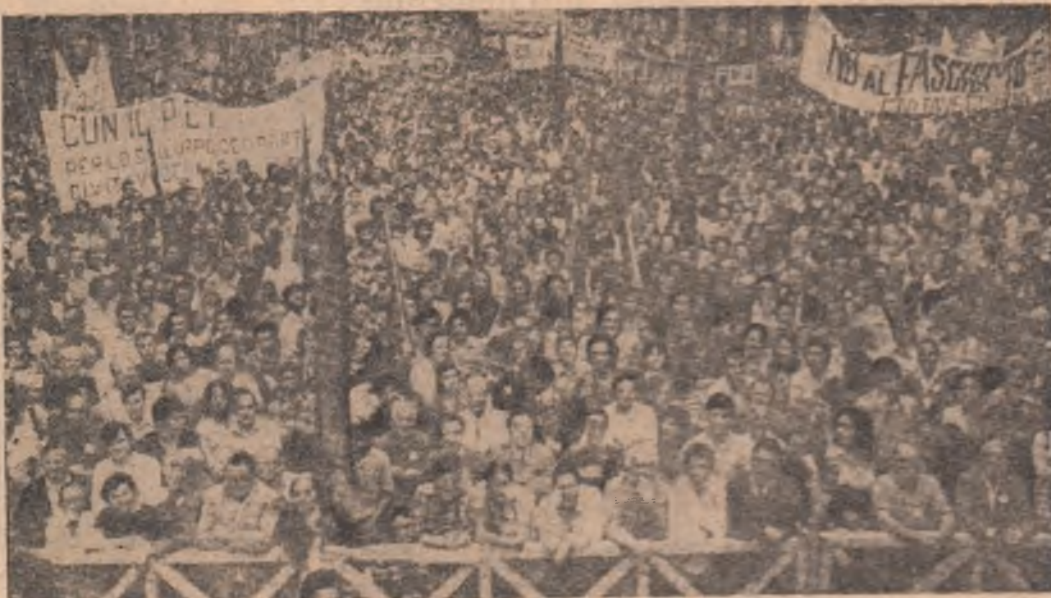
ITALIA: Aspect din timpul unei recente întrîlniri organizate de Partidul Comunist Italian, în vederea alegerilor administrative de la 15 iunie.

Ziarul „O Estado de Sao Paulo” publică un articol consacrat schimburilor comerciale dintre cele două țări și cooperării economice, perspectivele acestora. „Se atribuie o mare importanță — arată ziarul — noilor acorduri privind comerțul și transportul, care vor permite amplificarea schimburilor de mărfuri între cele două țări”. Posturile de radio și televiziune au transmis în direct momentele vizitei președintelui Nicolae Ceaușescu și a tovarășei Elena Ceaușescu, reflectind marele interes al opiniei publice față de prima vizită a unui șef de stat român în Brazilia, față de personalitatea președintelui Nicolae Ceaușescu, atribuind vizitei semnificația unui moment de referință istorică în dezvoltarea bunelor relații de prietenie și colaborare între România și Brazilia.