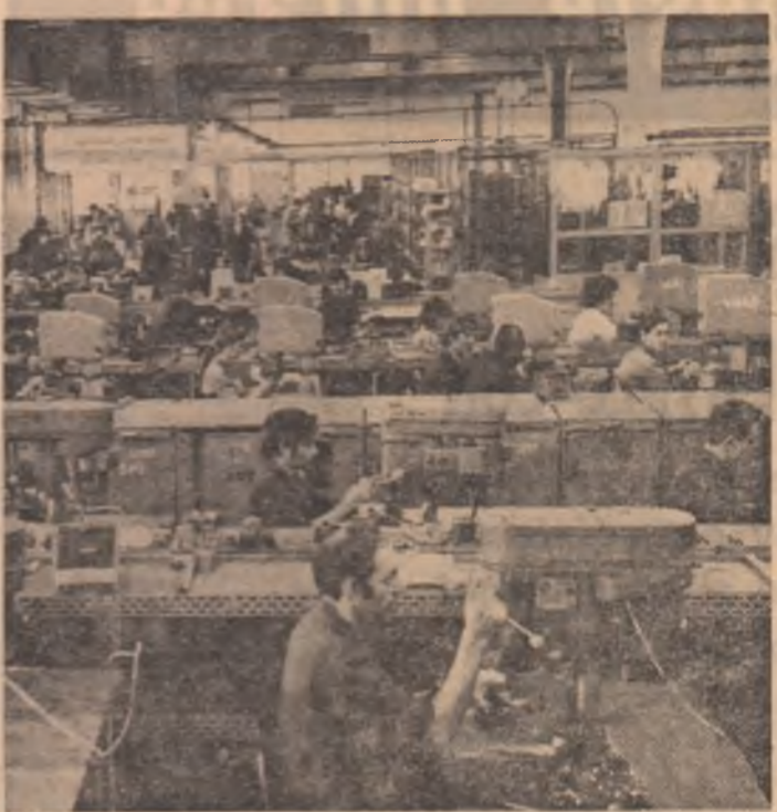
In una din secțiile atelierului montaj subsansamble nedemontabile ale întreprinderii „Electromureș” — Tg. Mureș.