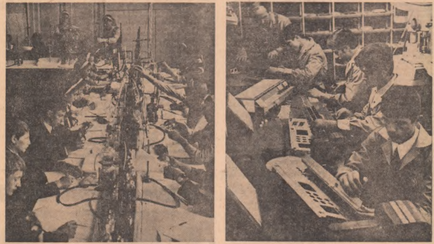
Ore de pregătire tehnico-productivă în laboratorul de tehnologia chimiei și atelierul de mecanică fină, realizate prin autodotare.