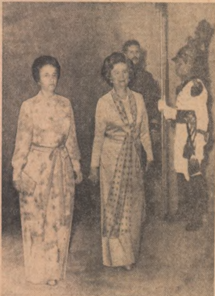
La dineul oficial oferit în onoarea înalților oaspeți români

Tinerii întâmpină Congresul al X-lea al U.T.C. și Conferința a X-a a U.A.S.C.R.