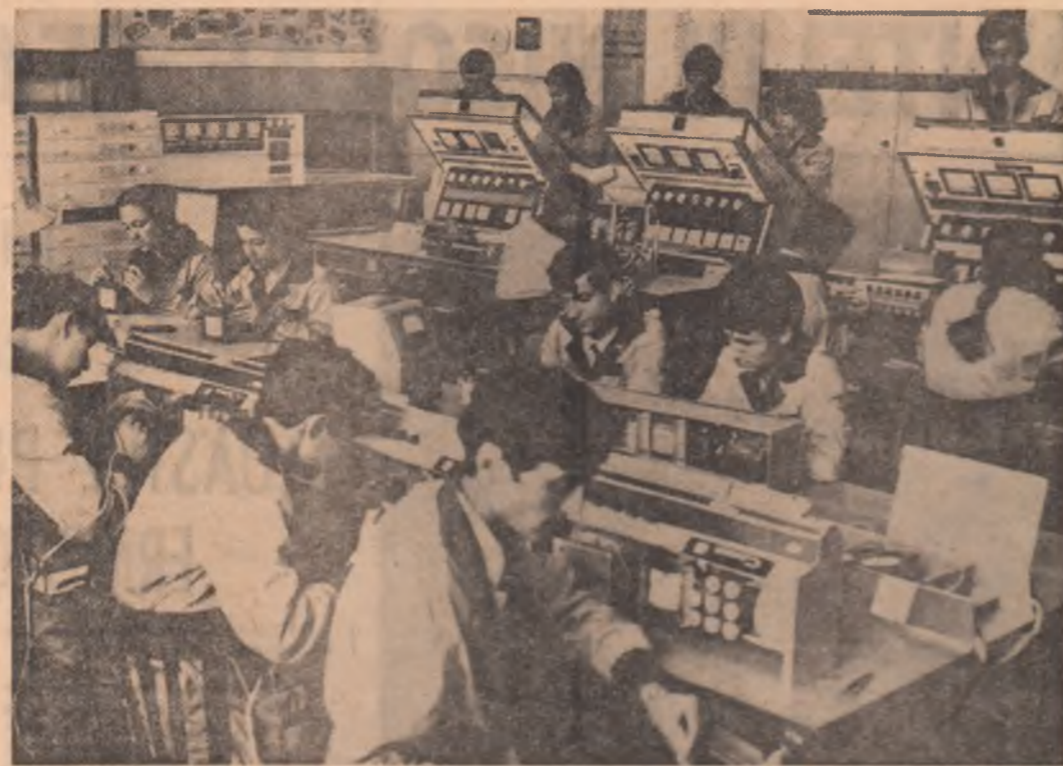
La faza de montaj, o complexă aparatură electronică. Muncitorii-eleci garantează pentru calitatea produselor care poartă marca „Celta”.