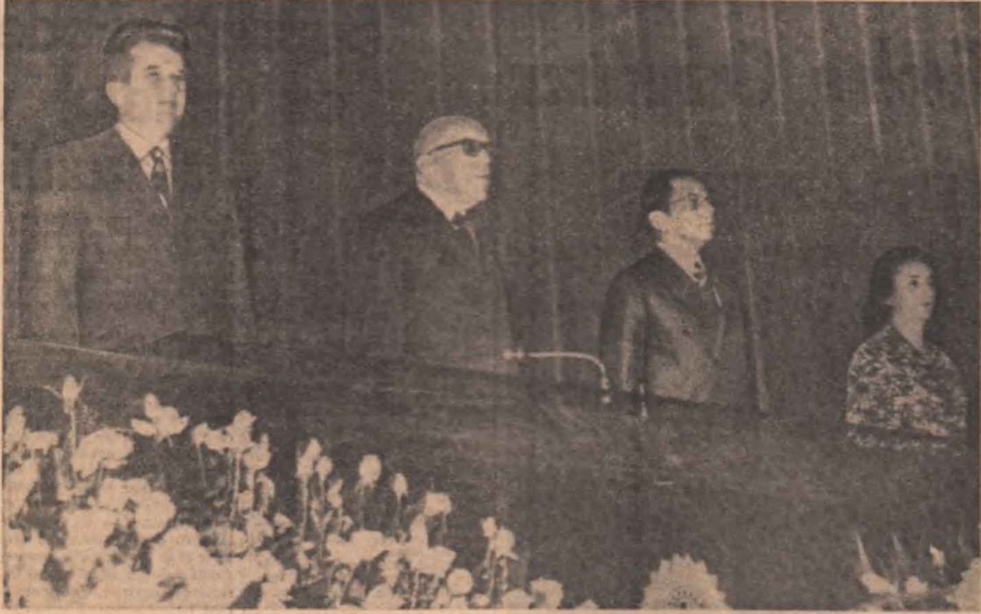
Înalții oaspeți români în timpul sesiunii speciale a celor două Camere ale Congresului Național Brazilian

legată nemijlocit de situarea sa în centrul celei mai importante zone industriale a Braziliei. Aici își au sediul marile firme industriale și comerciale, instituții bancare de tot felul, aici își desfășoară activitatea intensă o vastă rețea de magazine și de servicii în cele mai diferite domenii de activitate. Datorită concentrării în perimetrul marii oraș a mai bine de jumătate din operațiunile economice, financiare și de comerț exterior ale țării, precum și ritmului rapid al dezvoltării cunoscute această metropolă din zori și pînă noaptea tirziu, Sao Paulo a fost denumit, pe bună dreptate, capitala economică a Braziliei. Prezența președintelui Nicolae Ceaușescu în acest mare oraș al Braziliei — după vizita cu rezultate fructuoase făcută la Brasilia — a stîrnit un viu interes în rîndul cercurilor oficiale și de afaceri, precum și al opiniei publice a marii oraș. Ziarele locale, apărute vineri, au salutat sosirea președintelui Nicolae Ceaușescu și a tovarășii Elena Ceaușescu, în uriașă metropolă, dînd expresie bucuriei cetățenilor din Sao Paulo de a-și avea ca oaspeți pe solii poporului român. Vizita înalților oaspeți români la Sao Paulo și în zona industrială din împrejurimi este apreciată aici ca un eveniment important, menit să amplifice legăturile de prietenie și de cooperare în diferite domenii dintre România și Brazilia.