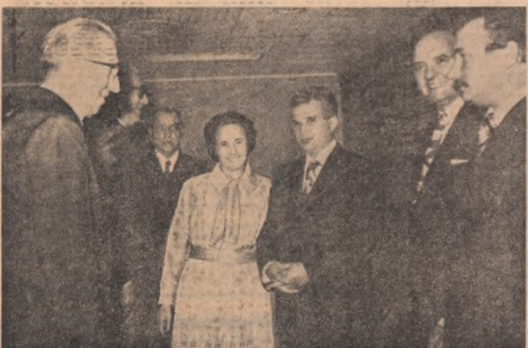
Înălți oaspeți români discutînd cu membri ai societății culturale „Brazilia-România”