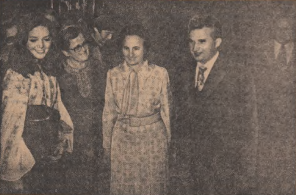
Emoționanta întîlnire din saloanele hotelului Hilton, din Sao Paulo, cu membrii coloniei române

rădăcinile adînci în latinitatea comună, vă consideră ca frate. Societatea noastră se afirmă și va crește în întreg statul Parana”. Vorbitoarea a arătat, totodată, că fiul ei — fost deputat federal — încetat din viață anul trecut, a fost un mare prieten al României, care a acționat intens pentru dezvoltarea relațiilor Braziliei cu România. A luat apoi cuvîntul tovarășul NICOLAE CEAUȘESCU. Ne-am înțeles cu președintele Braziliei asupra multor probleme, și așa ruga pe dumneavoastră, pe membrii conducerii societății care sîntei prezenți aici, citi și pe toți de origine română, și pe cei de origine portugheză sau de altele — pentru că în Brazilia sînt multe origini, dar toți sînt brazilieni și faceți totul pentru a contribui la dezvoltarea colaborării între popoarele noastre, pentru a crea o apropiere mai puternică în toate domeniile — economic, științific, cultural — să contribuim pe această cale numai la bunăstarea și fericirea popoarelor noastre — român și brazilian — dar și la cauza păcii și colaborării internaționale. (Aplauze) Cu aceste gânduri și sentimente, vă urez succes în activitatea pe care o desfășurați. Sper că mulți dintre dumneavoastră veți veni în România așa cum mulți din România vor veni în Brazilia. Vă doresc multă sănătate și multă fericire. (Aplauze)