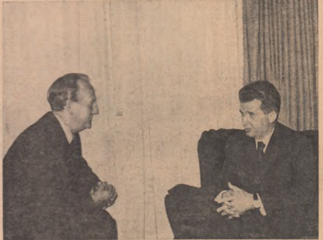
Cu ocazia vizitei la Londra, tovarășul Nicolae Ceaușescu, secretar general al P.C.R., s-a întâlnit cu Gordon McLennan, secretar general al P.C. din Marea Britanie.