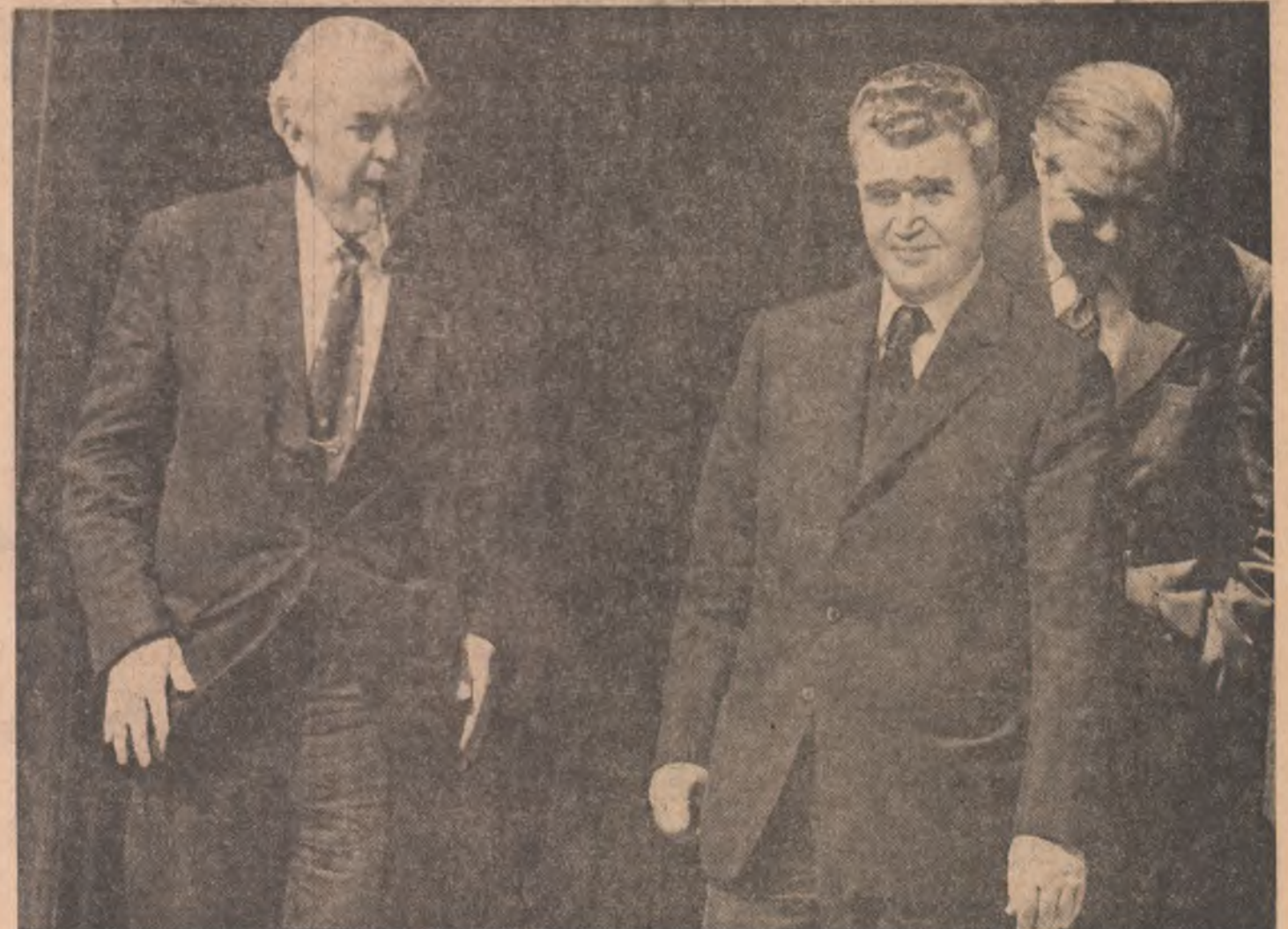
Tovarășul Nicolae Ceaușescu, președintele Republicii Socialiste România, a avut, joi dimineața,