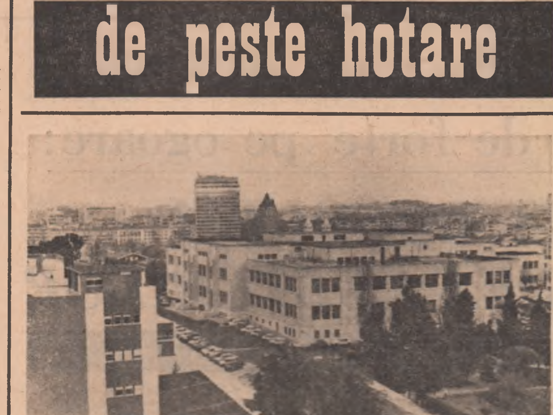
PORTUGALIA. Vedere din Lisabona

SESIUNI Intre 10 și 12 iunie la București s-au desfășurat lucrările celei de-a VI-a sesiuni a Comisiei mixte româno-finlandeze de cooperare economică, indus-