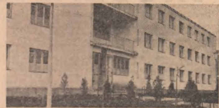
Căminul pentru nefamiliști din cadrul Întreprinderii „Tehnofrig” Cluj-Napoca

De la o primă privire, căminul tinerilor nefamiliști ai întreprinderii clujene „Tehnofrig” te invită, așa cum te cheamă să-i calci pragul orice casă de bun gospodar. Curtea spațioasă, cu răsunări proaspete de flori, holul cu fotolii comode, dovedesc o dată în plus că și bărbății, chiar și cei tineri, dispun de „talentul” unei bune gospodărie.