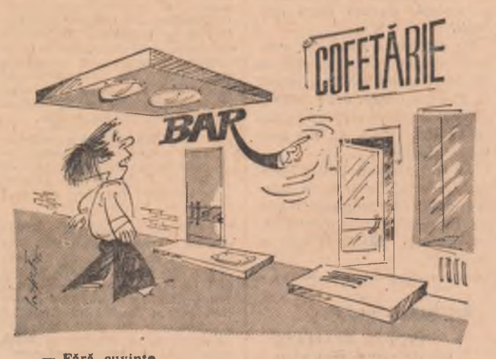
— Fără cuvinte