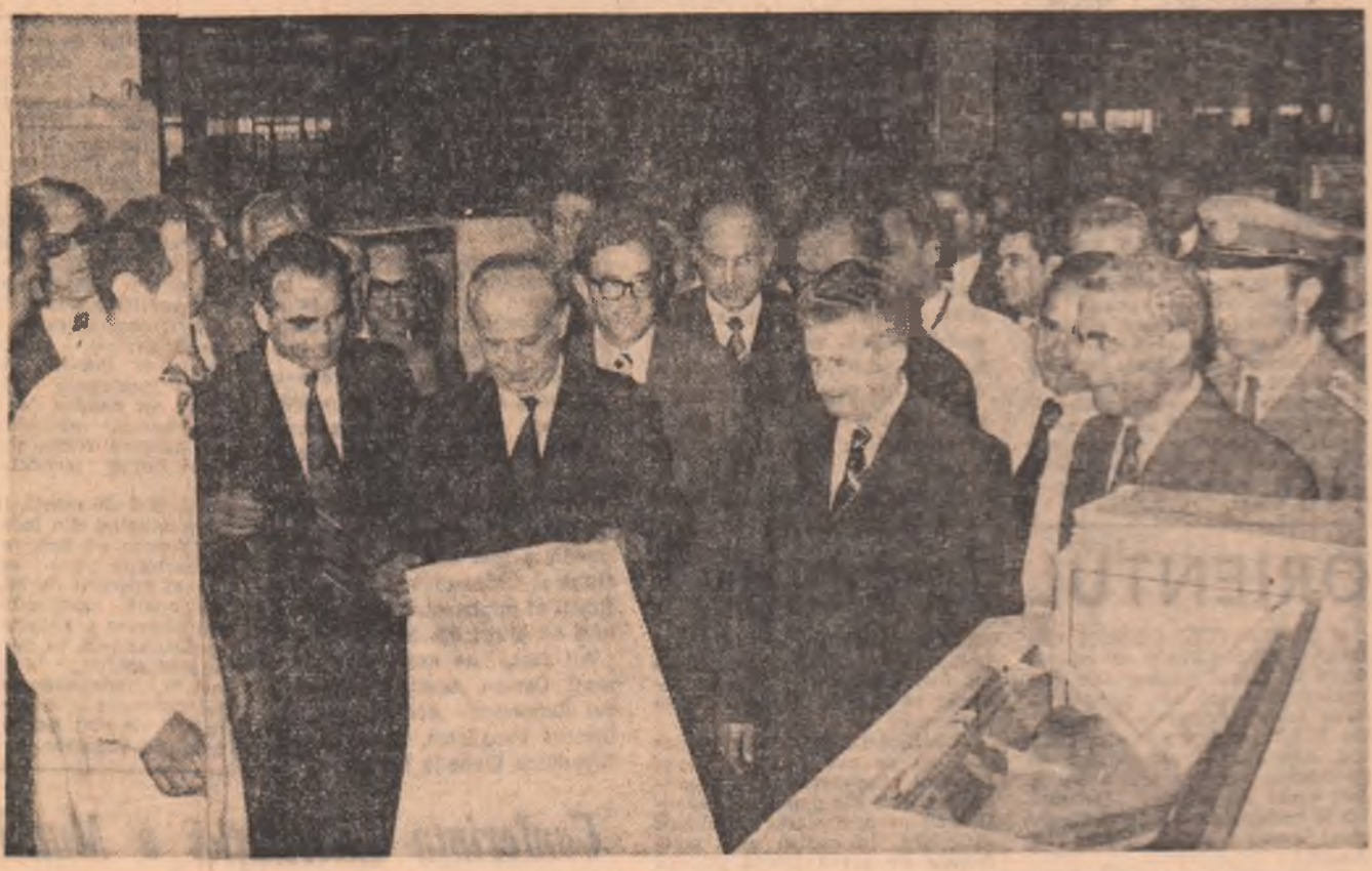
La Fabrica de calculatoare

Numerosi bucureșteni, aflați pe aeroport, au salutat cu căldură, cu sentimente de înaltă stimă și prețuire pe tovarășii Nicolae Ceaușescu și Todor Jivkov, ovaționînd pentru prietenia româno-bulgară, pentru conlucrarea frățească dintre cele două țări și popoare.