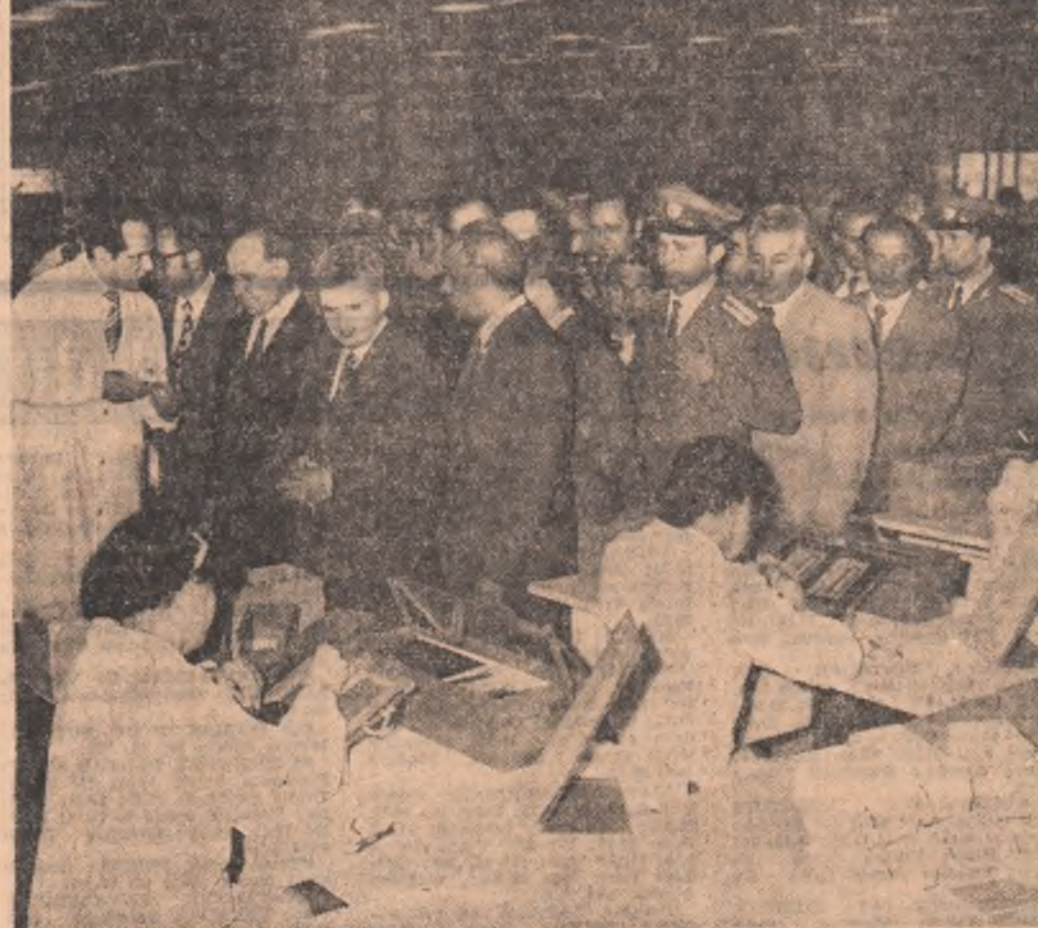
Calculatoarele electronice, rod al investiției de inteligență a specialiștilor români, se bucură de o înaltă apreciere din partea înalților oaspeți