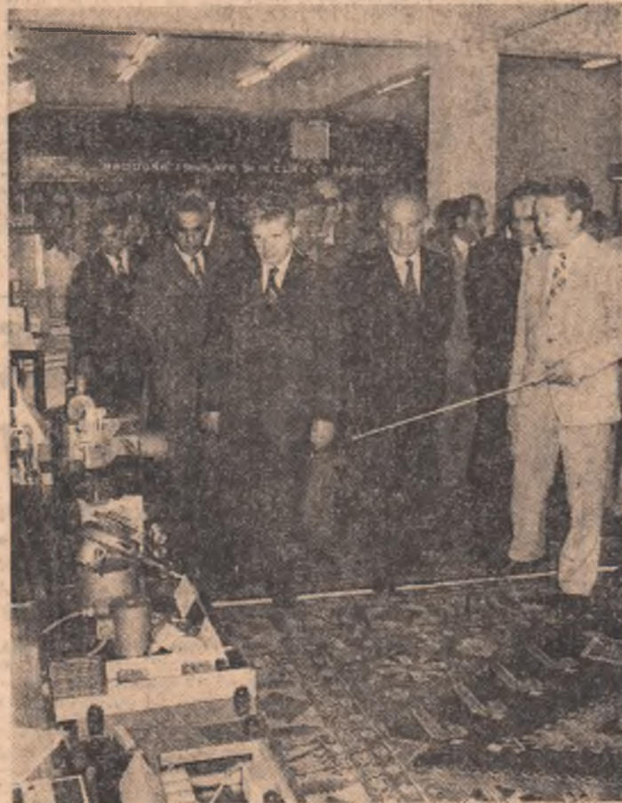
La Fabrica de cinescoape, în cadrul unei expoziții, sînt prezentate produse ale industriei electronice și electrotehnice românești