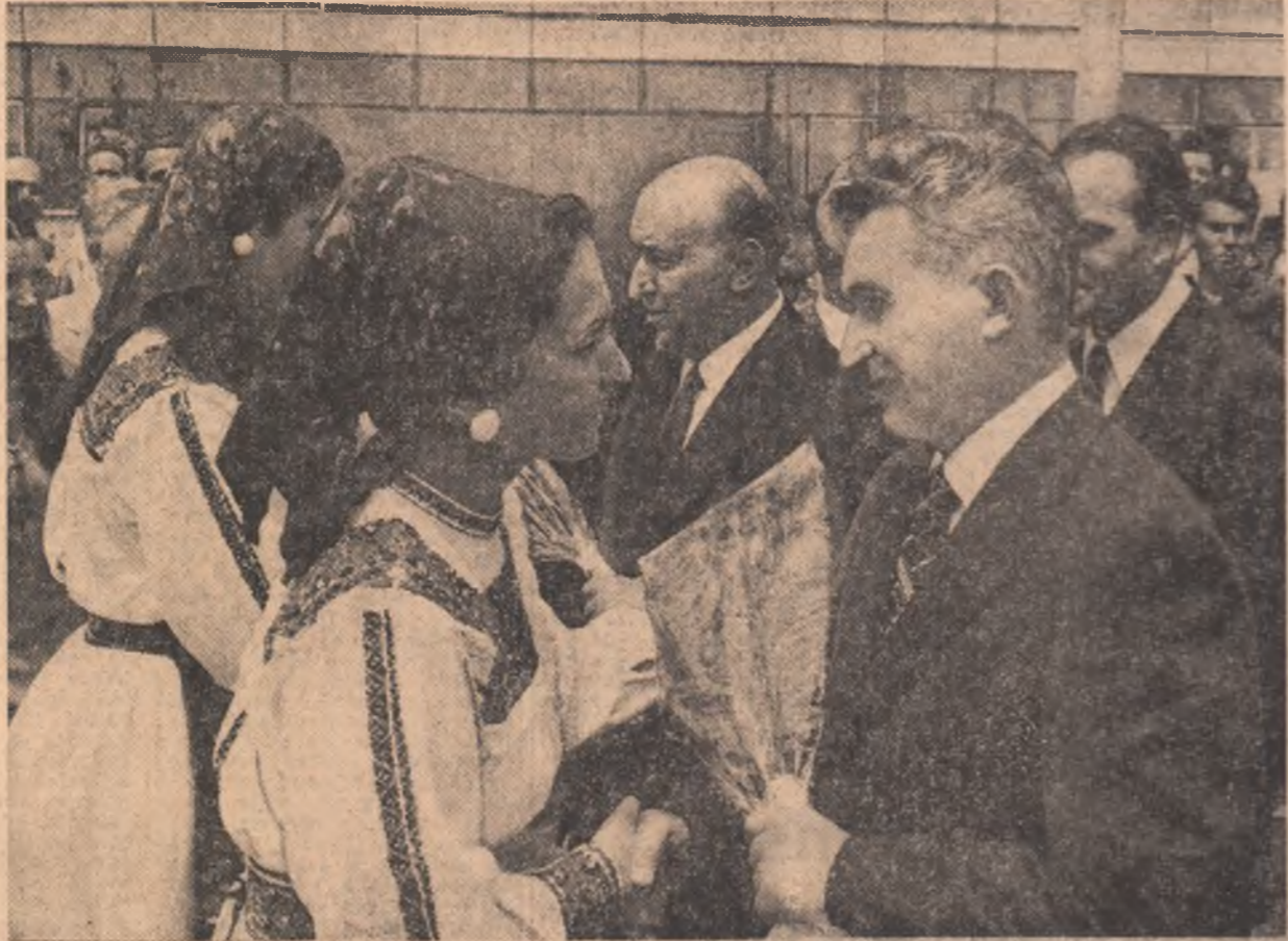
Tânzii oaspeți sînt întîmpinați cu sentimente de profundă stimă și prejură

● Vizita în întreprinderile industriei electronice și electrotehnice — un prilej pentru cunoașterea realizărilor obținute de poporul român, de aprofundare a colaborării bilaterale