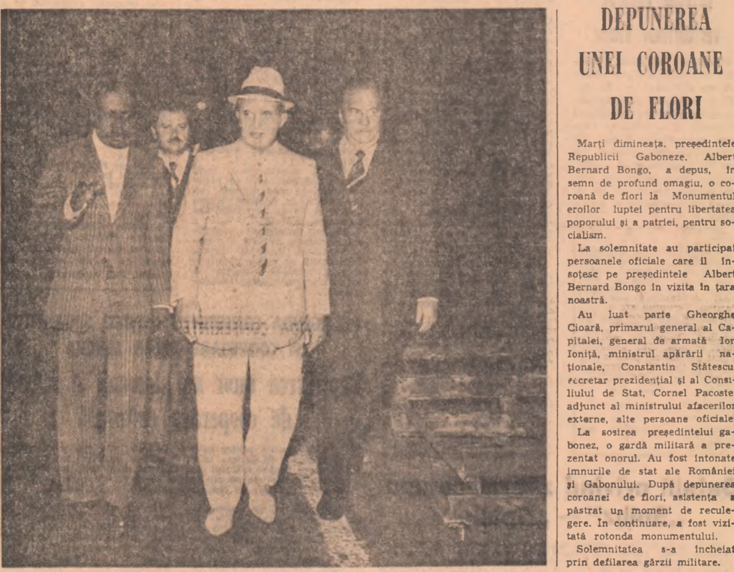
DEPUNEREA UNEI COROANE DE FLORI

Marți dimineață, președintele Republicii Gaboneze, Albert Bernard Bongo, a depus, în semn de profund omagiu, o coroană de flori la Monumentul eroilor luptei pentru libertatea poporului și a patriei, pentru socialism.