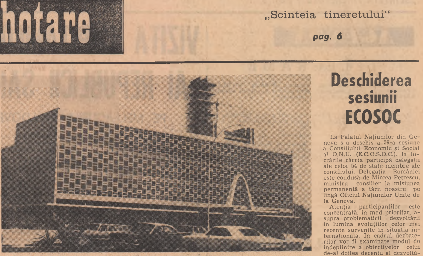
KUWEIT: Moderna clădire a parlamentului.