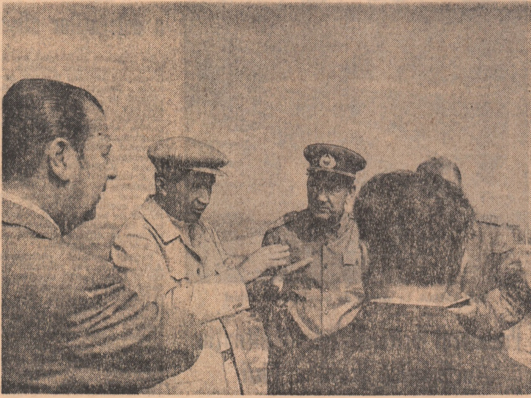
să ridice noi diguri, să consolideze pe cele existente, să apere malurile de viitură. Tovarășul Nicolae Ceaușescu

ase fel încât amenajările să reziste la viituri cum au fost cele din 1970 și de acum, să reziste în orice condiții — a subliniat în continuare tovarășul Nicolae Ceaușescu, trasind sarcina înființării unui organism special profilat pe întreținerea și exploatarea fluviilor. El va trebui să fie dotat cu toate utilajele necesare pentru executarea lucrărilor de acest gen, dar va trebui să antreneze la acțiuni eficiente de regularizare și decolmatare pe cetățenii tuturor orașelor și comunelor, care vor avea sarcini sporite în întreținerea cursurilor de apă de pe raza localităților. Tovarășul Nicolae Ceaușescu cere, totodată, să se pună la punct un sistem mai eficient de pază a amenajărilor și de urmărire a debitelor, de informare și avertizare operativă asupra eventualelor pericole. Acestul organism îl vor reveni, de asemenea, răspunderi și pe linia controlului poluării apelor. Va trebui să vedem — arată tovarășul Nicolae Ceaușescu — și modul în care pregătesc instalațiile noastre de învățământ specializate de care are nevoie acest sector. Toate aceste probleme vor constitui obiectul dezbaterilor unei conferințe pe care va participa toți specialiștii din acest domeniu.