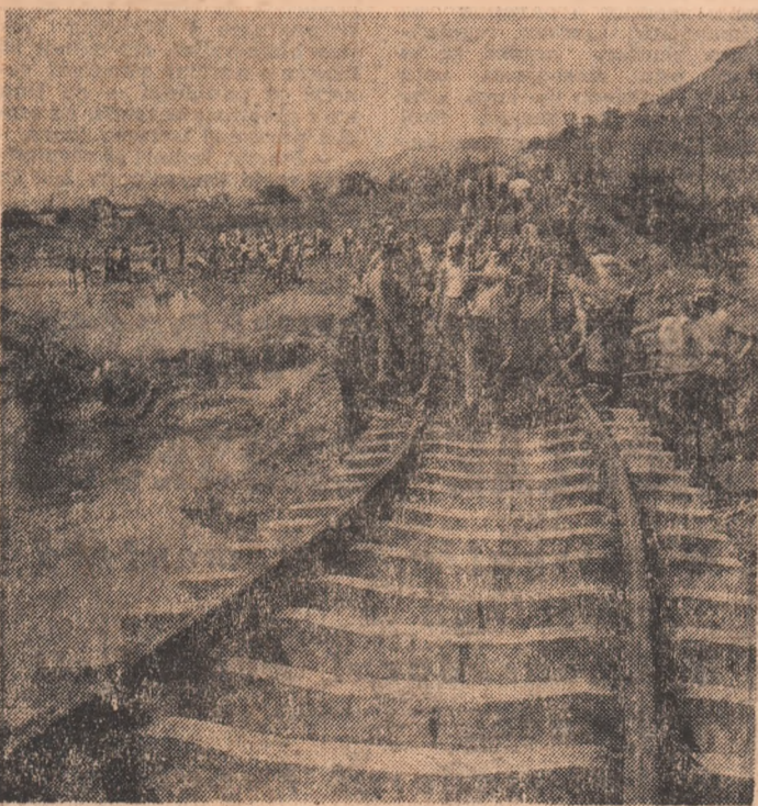
Cu spirit de responsabilitate și bărbăție, militarii forțelor noastre armate lucrează intens la repunerea în circulație a traseelor de cale ferată.