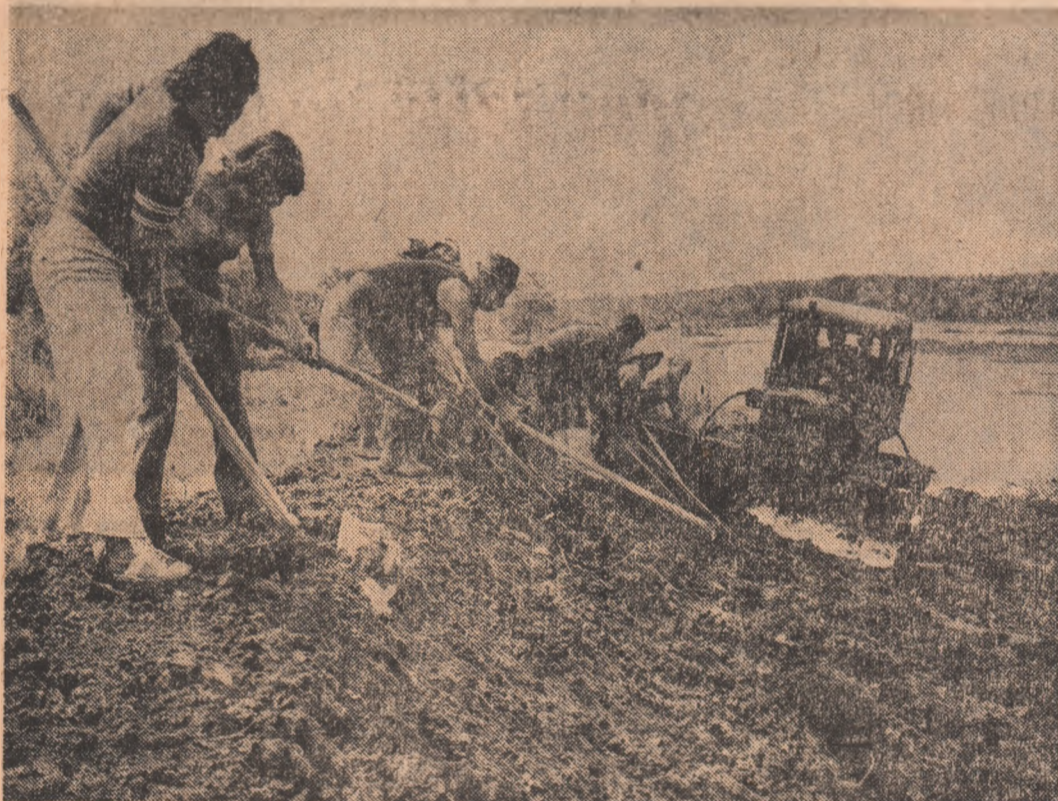
La Săndreni, județul Galați, acolo unde nivelul Stretului se anunță în creștere, locuitorii consolidează digurile care apără satul și grădina de legume.

Răspunzînd chemării tovarășului Nicolae Ceaușescu de a face totul pentru diminuarea pagubelor pricinuite economiei naționale de inundațiile catastrofale din mai multe județe ale țării, numeroase colective din întreprinderile industriale din Galați și-au intensificat eforturile pentru obținerea de producții suplimentare prin prelungirea zilei de muncă, prin organizarea unor zile și săptămîni record. O inițiativă a tinerilor din mai multe secții ale Combina-