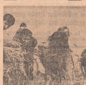
În județul Mureș, ca în toate județele afectate de inundații, se dă bătălia pentru limitarea pagubelor pricinuite de revărsarea și bălțirea apelor, pentru readucerea la normal a întregii activități în unitățile economice afectate.

Nici un efort nu este prea mare pentru salvarea recoltelor care așteaptă în cîmp! La cooperativa agricolă Oltenița, județul Ilfov, elevii Grupului școlar de pe lângă Șantier naval acționează cu energie pentru recoltarea grîului de pe parcelele inundate.