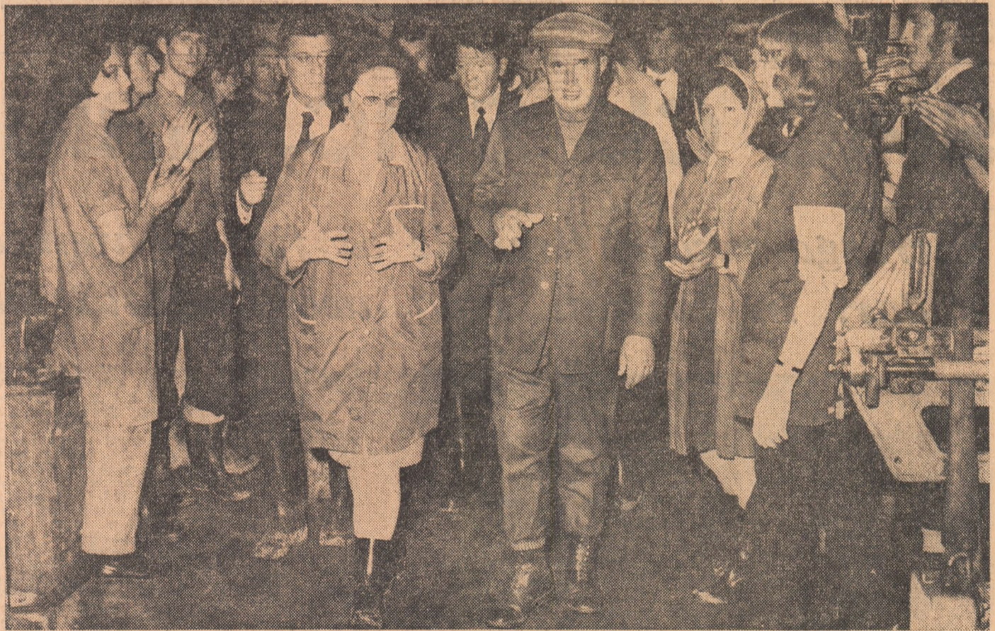
La Întreprinderea de stoffe din Sighișoara

Conform stării de necesitate, tineri și vîrstnici, bărbați și femei, studenți sau elevi,