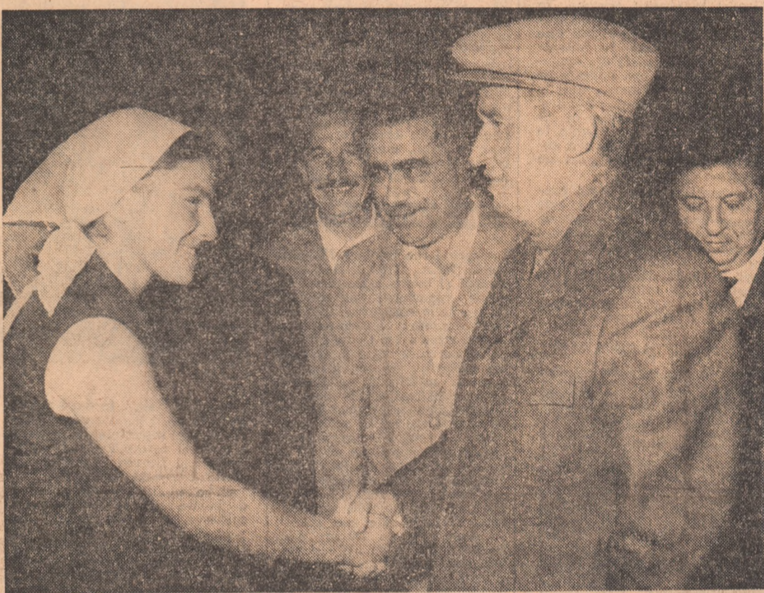
La Fabrica de sără din Odorheiu Secuiesc