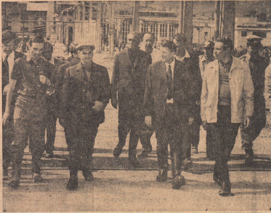
Chimșii din Tirnăveni raportează tovarășului Nicolae Ceaușescu reluarea activității productive.

situația existentă, măsurile care au fost luate pentru repunerea în funcțiune a unităților afectate, pentru restabilirea vieții normale. În dreptul unuia din digurile de protecție a orașului, care a fost spart pentru a se în-