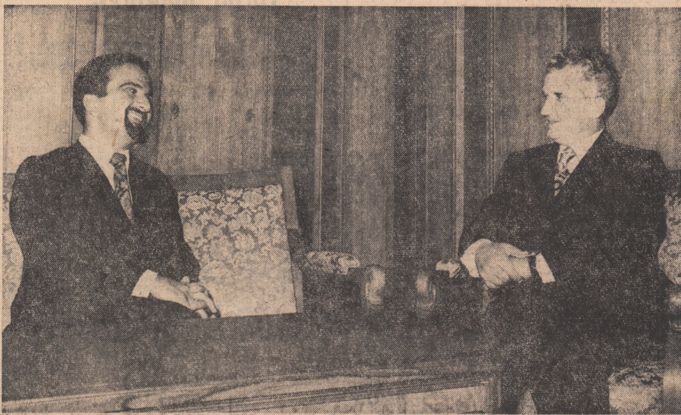
cooperare pe baze noi în Europa, pentru realizarea unei păci juste și durabile în Orientul

Au fost examinate, totodată, probleme ale actualității politice internaționale, subliniindu-se necesitatea de a se întreprinde noi eforturi pentru democratizarea relațiilor internaționale, pentru eliminarea pe cale politică a surselor de încordare și conflict existente, pentru înfăptuirea unui sistem de securitate și