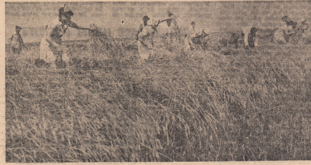
Activitate intensă pe ogoarele C.A.P. Tătărești, Ilfov