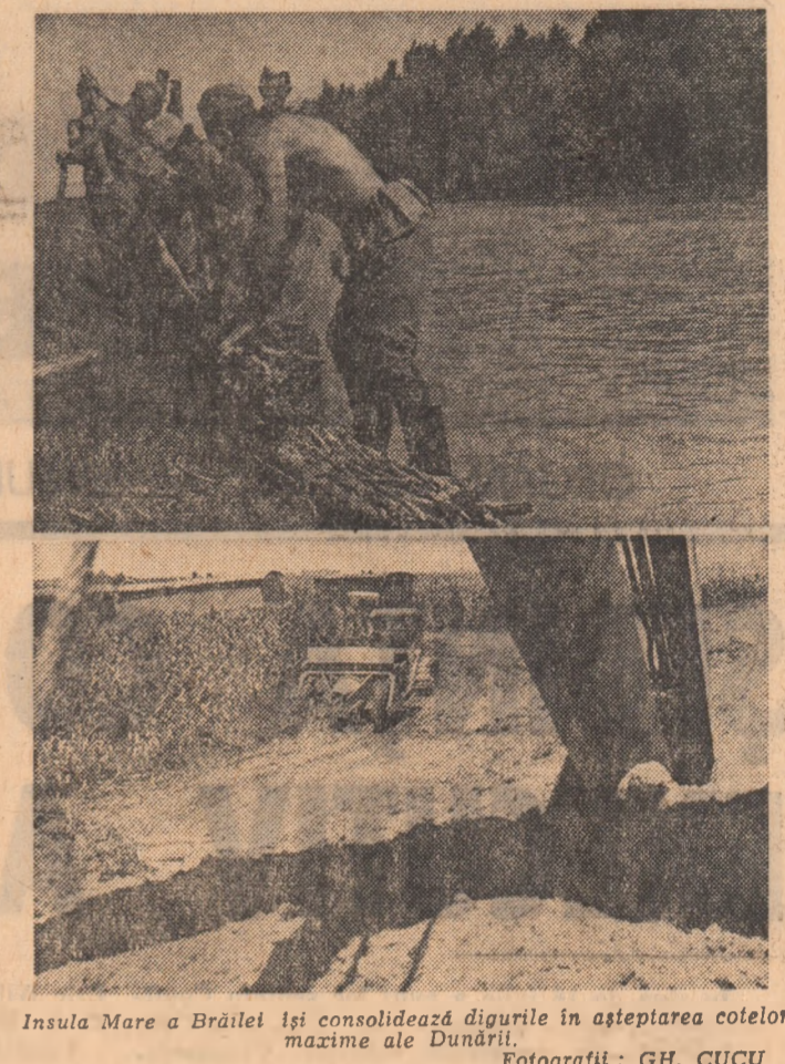
Insula Mare a Brăilei își consolidează digurile în așteptarea cotelor maxime ale Dunării.

„FURNALUL TINEREȚII“ — așa a fost numit furnalul nr. 4 de 1.700 metri cubi de la Combinatul siderurgic Galați. Motivul: tinerii de aici, hotărîți să îndeplinească cel de-al X-lea Congres al U.T.C. cu noi succese în muncă, au pus în activitate de exploatare a agregatului. Ei s-au angajat să depășească sarcinile de plan cu 2 la sută, să reducă consumul de coes cu 2 kg la tona de fontă elaborată, să evite pe cit posibil opririle accidentale și să scurteze timpurile de revizie și reparării prin participarea lor la această activitate.