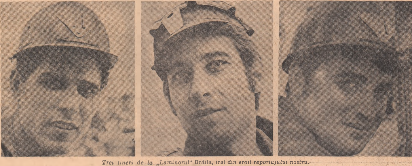
Trei tineri de la „Laminorul” Brăila, trei din eroii reportajului nostru.