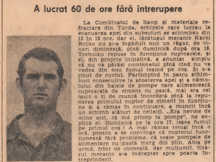
A lucrat 60 de ore fără întrerupere

După mai multe zile și nopți de grea și incertăntă luptă cu apele, de muncă diră pentru vindecarea rînilor lăuate de revărsarea Argeșului, la Turda viața și-a reluat cursul normal. Toate întreprinderile afectate de inundații — „Electroceram”, „Cimentul”, „Sider”, întreprinderea chimică, cea de materiale de construcții, au reintrat în funcțiune și produc la întreaga capacitate. Fiecare din cei peste 3.000 de tineri din unitățile afectate de inundații a participat, muncind eroic, la repararea și înălțarea înălțăturii nămolului din hale, de pe străzi și din case. În fațetele celor trei tineri pe care-i prezentăm aici se regăsește totuși ceilalți.