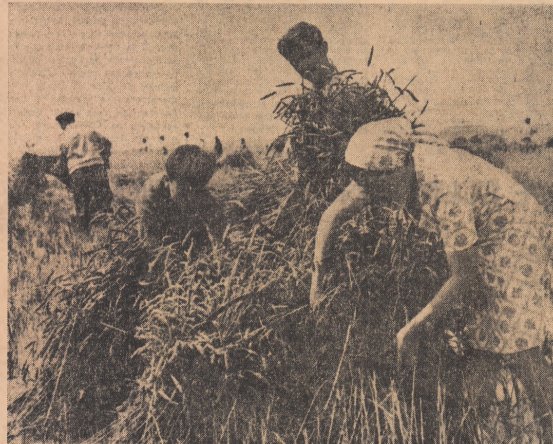
Unde nu intră combinele, intră secerătorile

toarele primite din județele Bistrița-Năsăud și Ialomița, rezultatele nu sînt dintre cele mai bune. Spunem aceasta deoarece în județul Argeș mai trebuie strins de pe suprafața de 29.292 hectare, iar în unele unități agricole cum sînt cele de pe raza consiliilor intercooperatiste Birla, Căteasca, Costești, Miroși recolta nu e strinsă nici