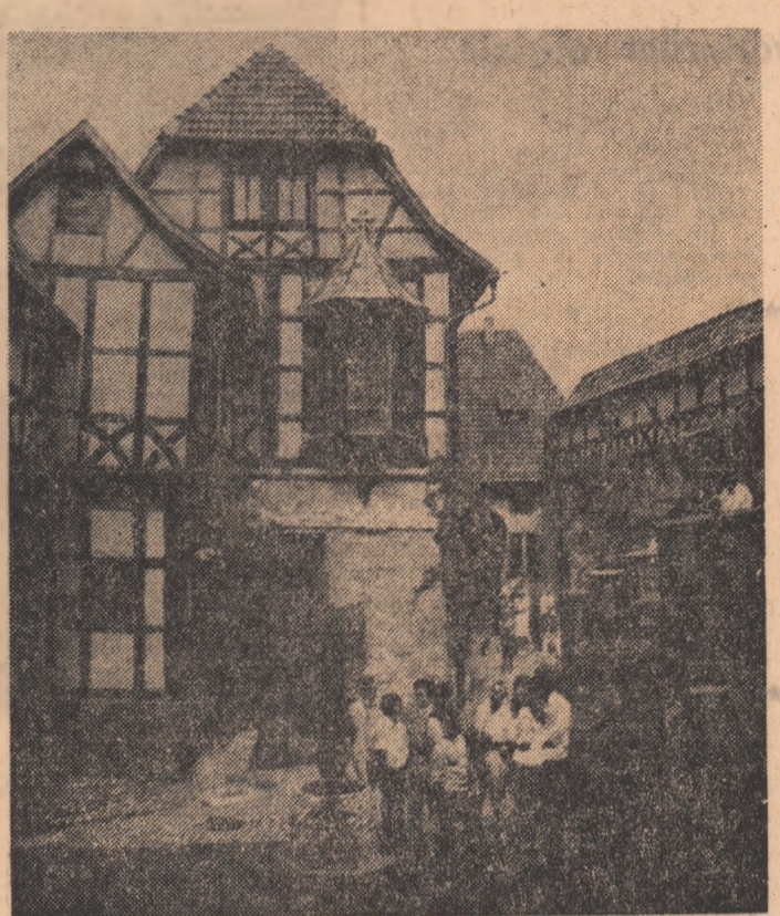
R.D. GERMANA. Un monument adeseori vizitat de turiști este catedrala Warburg de lângă Eisenach