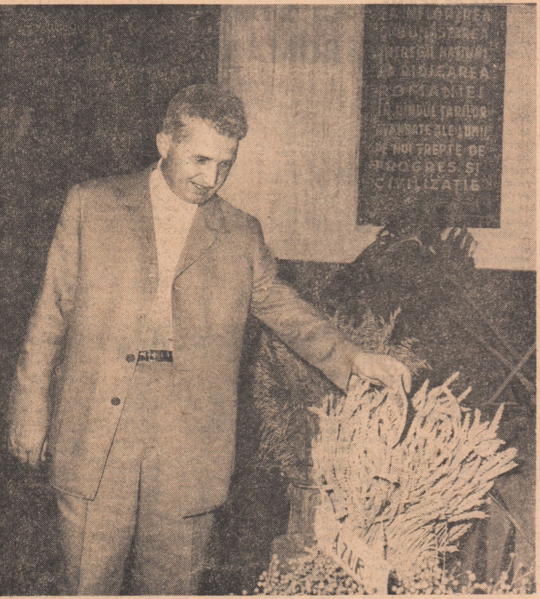
Producții superioare agricole de pe terenurile erodate din zona Perieni — Birlad