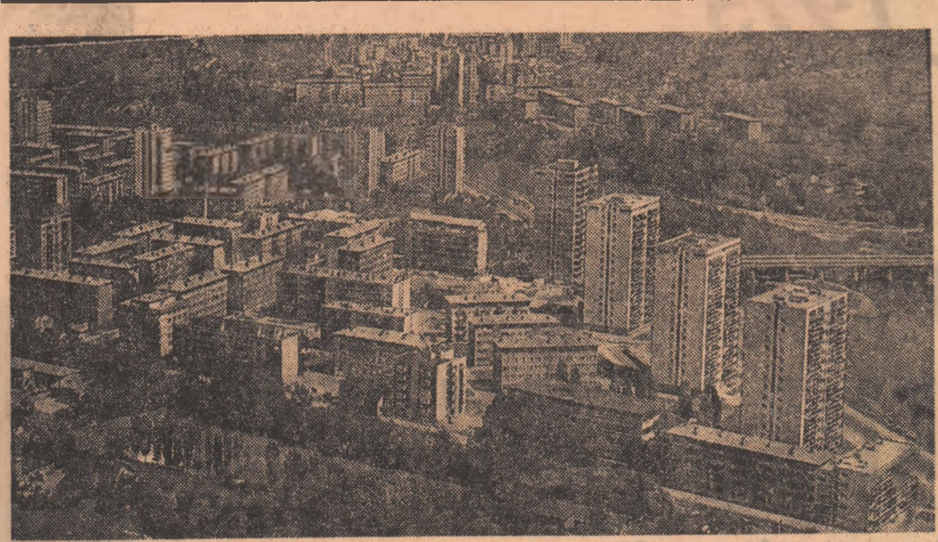
R.S.F. JUGOSLAVIA - Imagine a orasului Zenica. Din cei 90.000 de locuitori ai orasului 20.000 sînt elevi si studenți. La Zenica se află, de asemenea, aproximativ 50 de institutii de învățămînt, începînd de la școlile elementare pînă la Facultatea metalurgică.