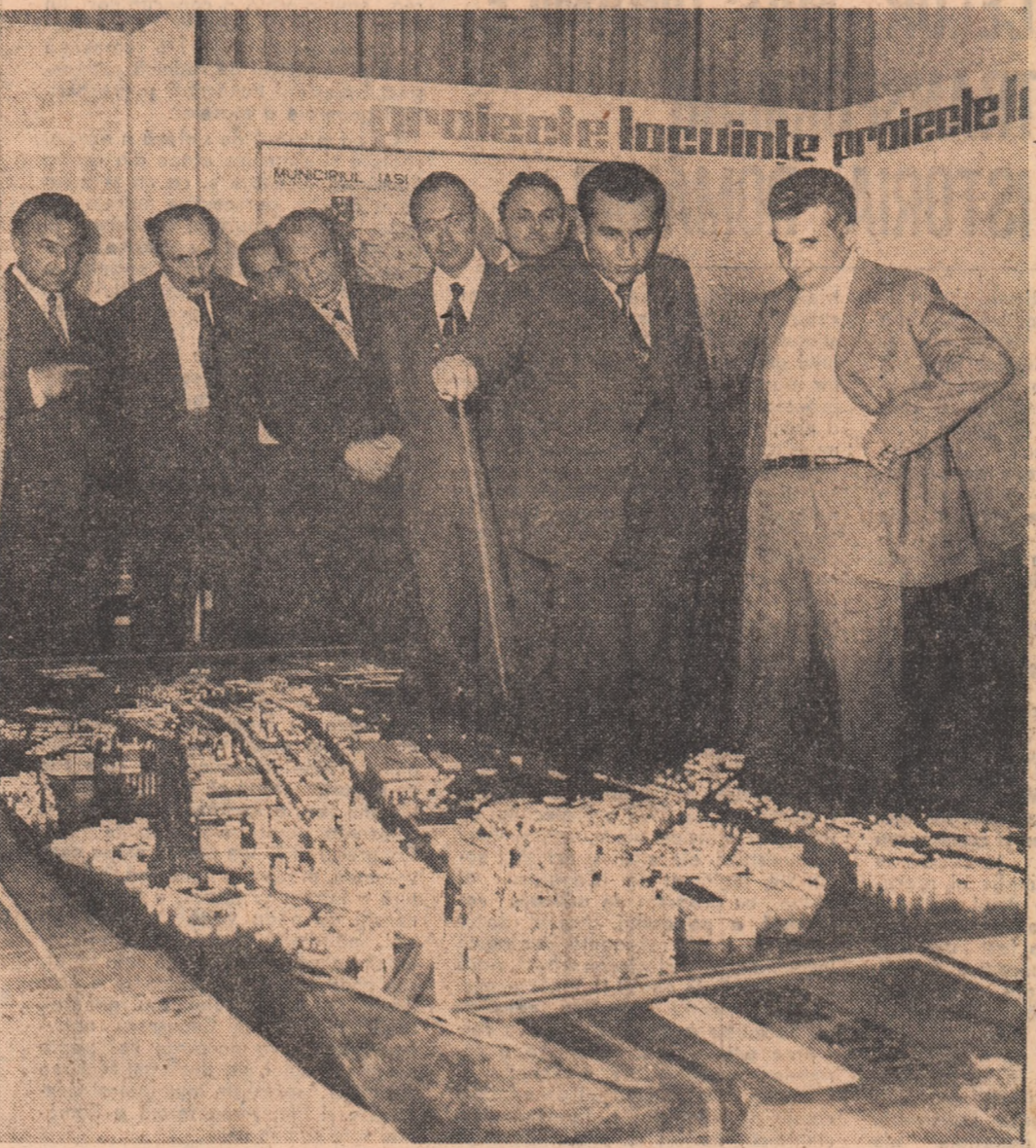
Se pregătesc vilfoarele ipostaze ale Iașilor