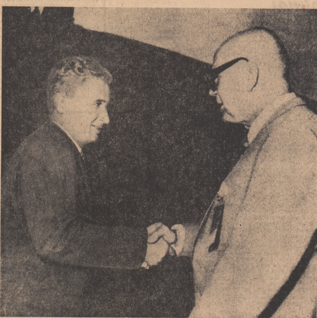
Pe aeroportul din Helsinki, tovarășul Nicolae Ceaușescu a fost întâmpinat și salutat cu deosebită cordialitate de președintele Republicii Finlanda, Urho Kekkonen.

La ora 14.15 aeronava prezidențială a decolat.