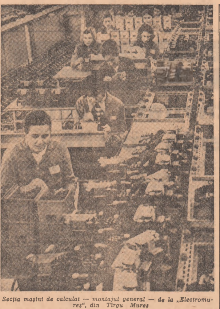
Secția mașini de calculat — montajul general — de la „Electromureș”, din Tirgu Mureș