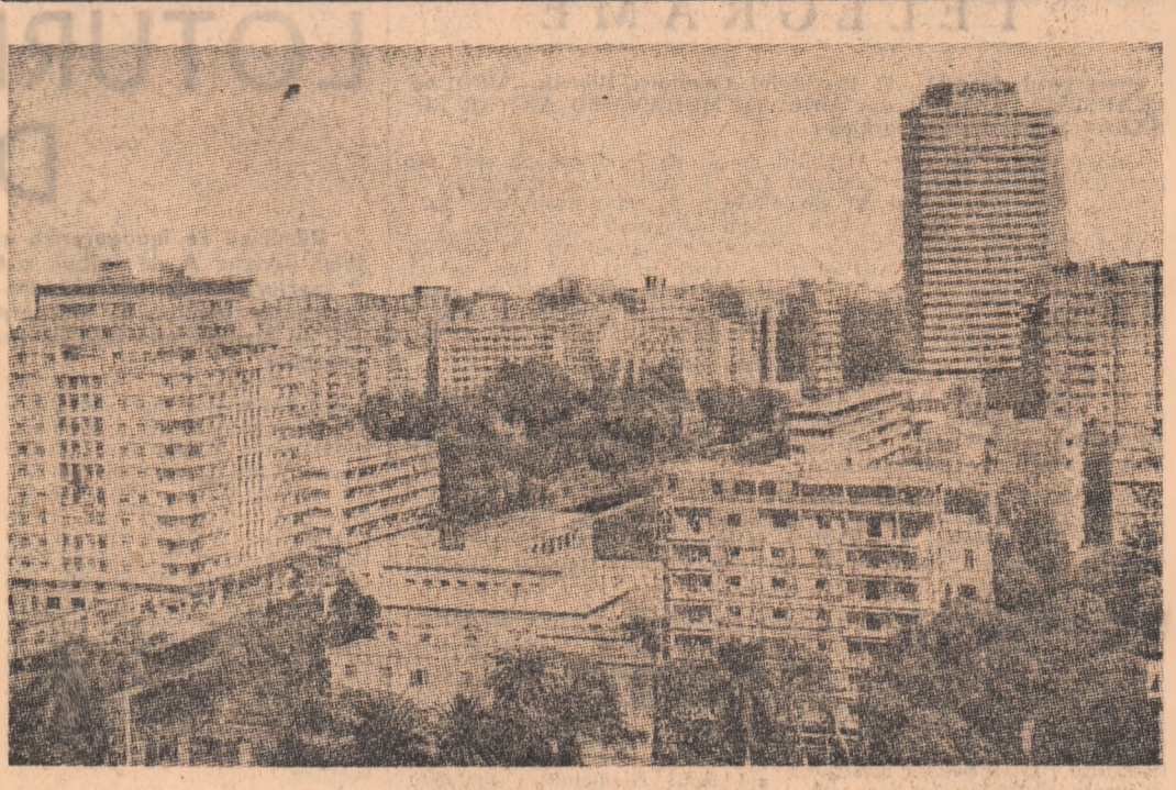
R. A. EGIPT - Vedere din Cairo

Hotărîre cu privire la reluarea dialogului dintre țările producătoare și cele consumatoare de energie și materii prime