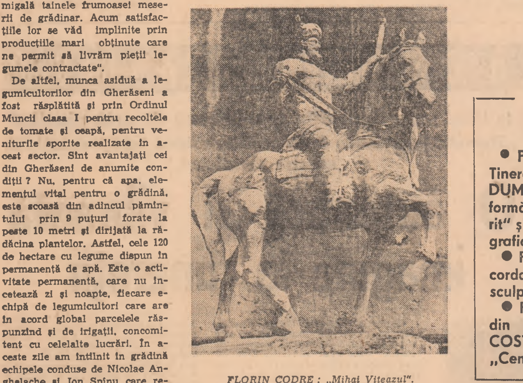
FLORIN CODRE: „Mihai Viteazul”.