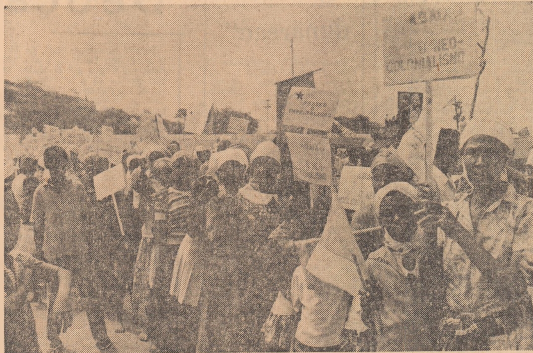
INSULELE CAPULUI VERDE — Demonstrație în sprijinul politicii independente a guvernului

Primele măsuri pe care le va adopta noua echipă guvernamentală înscărunțată cu conducerea economiei argentine vor avea drept obiective reducerea deficitului bugetar, echilibrarea balanței de plăți și diminuarea inflației, a declarat, în cursul unei reuniuni cu mai mulți secretari de stat, noul ministru al economiei, Antonio Cafiero. Fără a preciza în ce vor consta aceste măsuri, Cafiero a cerut un interval de mai multe zile pentru a pune la punct o strategie economică destinată realizării acestor scopuri. El a arătat, totodată, că în cursul săptămânii viitoare va avea loc o reuniune cu conducătorii Confederației Generale a Muncii (C.G.T.), precum și cu reprezentanții ai cercurilor industriale, consacrată examinării situației economice a țării.