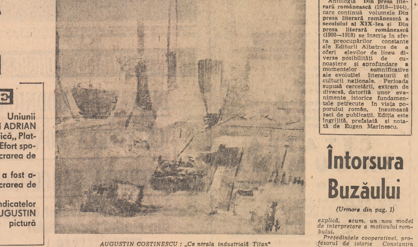
AUGUSTIN COSTINESCU: „Centrala industrială Titan”.