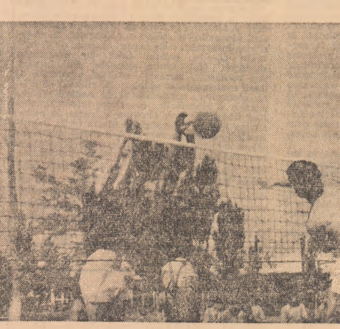
Pasionantă luptă la fileu

Tinerii sportivi din Alba Iulia, Sebes și Sighetul Marmatiei, din comunele Albac și Mihaiș au fost, în acest sezon, protagoniștii unor ample concursuri de masă dedicate celui de-al X-lea Congres al U.T.C. și Conferinței a X-a a U.A.S.C.R. Timp de aproape șase săptămîni, ei și-au disputat înfrîngerile pe pistele amenajate pentru probele atletice de viteză și semifond.