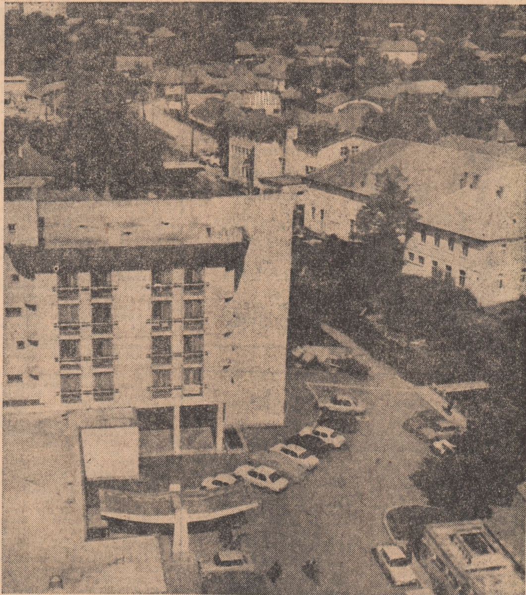
vedere panoramică a orașului Covasna

ALEX. ȘTEFĂNESCU (Continuare în pag. a II-a)