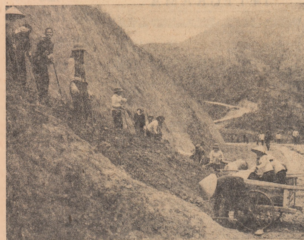
LAOS — Acțiuni de reconstrucție în satul Vieng Xay, situat în apropierea capitalei provinciale Sam Neua