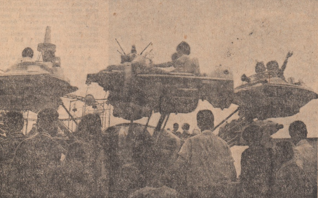
In orașeul copilului din Parcul Tineretului din Capitală