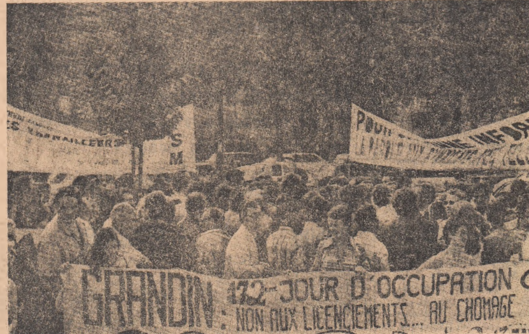
FRANȚA: demonstrație la Paris împotriva creșterii șomajului

● PESTE OPT MII de hectare pădure au fost mistuite de flăcările unui violent incendiu declanșat săptămîna trecută în provincia spaniolă Granada. În pofida eforturilor echipelor de