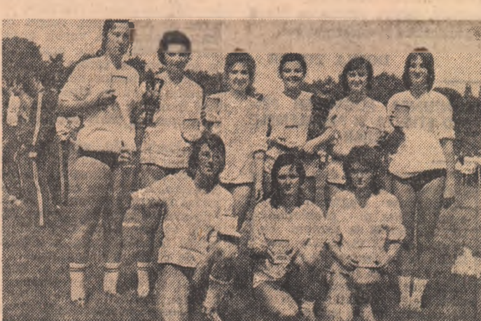
Locul I volei fete: selecționata județeană Alba