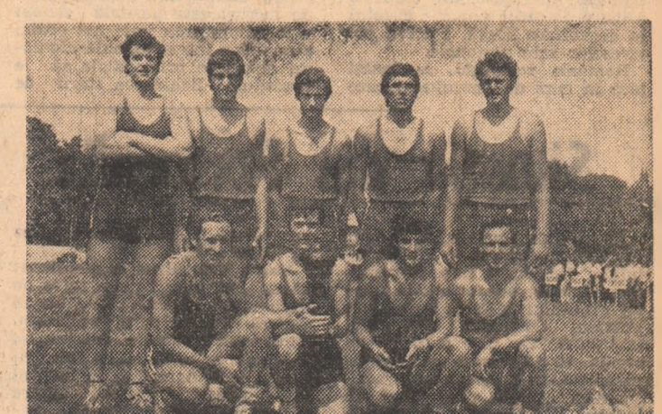
Locul I volei băieți: selecționata municipiului București