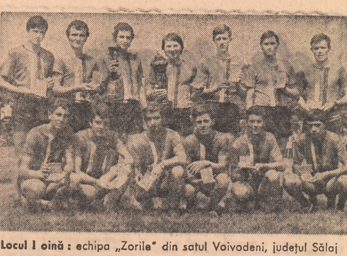
Locul I oină: echipa „Zorile” din satul Voivodeni, județul Săloj