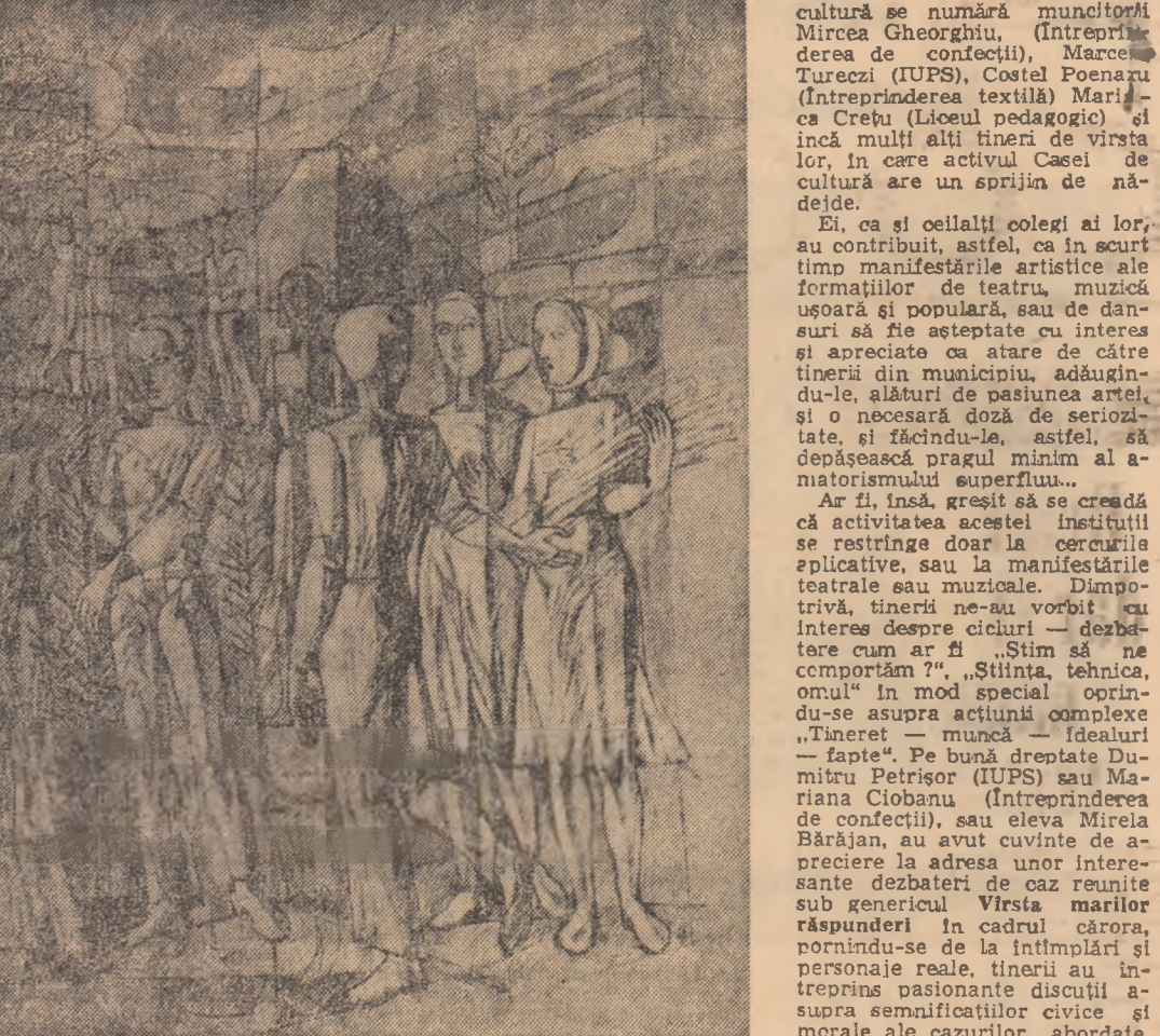
Lucrarea lui Vasile Celmare, de mai mari dimensiuni „Tineri vîrstare” este concepută ca o alegorie a tinereții. Procedul artistic, accentul pus pe compoziție și conținutul sugerează acceptarea rigorilor clasicismului, firește, dintr-o perspectivă contemporană. Autorul ignoră detaliul pitoresc, în favoarea esteticității arhitecturii intrinseci lucrării, implicit a clarității sensurilor acesteia, a pregnanței ima-