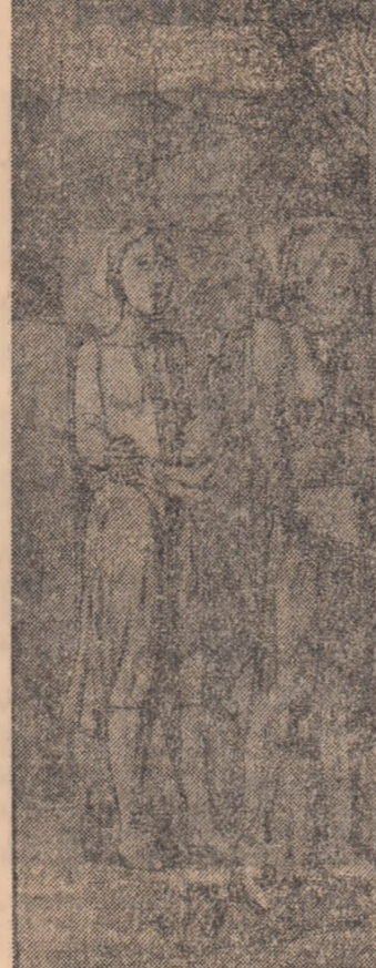
Lucrarea lui Vasile Celmare, de mai mari dimensiuni „Tineri vîrstare” este concepută ca o alegorie a tinereții. Procedul artistic, accentul pus pe compoziție și conținutul sugerează acceptarea rigorilor clasicismului, firește, dintr-o perspectivă contemporană. Autorul ignoră detaliul pitoresc, în favoarea esteticității arhitecturii intrinseci lucrării, implicit a clarității sensurilor acesteia, a pregnanței ima-