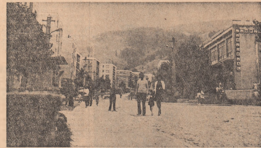
Borșa, în orele de după-amiază.

În ziua deplasării noastre la Găești, la sediul I.A.S. (satul Cuparu, comuna Dragodana) a-vea loc adunarea reprezentanților oamenilor muncii din unitate. A fost, astfel, un bine venit prilej de analiză critică a activității de pînă acum. În special de luare a unor măsuri pentru buna desfășurare a campaniei de toamnă. Au fost revăzute graficele de lucru pe cele patru ferme vegetale (obozoaia, Răsciești, Morteni și Măteșaru) și două zootehnice (Cuparu și Petrești) — au fost adoptate programe concrete de acțiune și intervenție pe tarile, loturi, echipaje de lucru. În spiritul măsurilor stabilite de Comitetul Politic Executiv al C.C. al P.C.R. din 26 august a.c., au fost repartizate răspunderi precise pentru fiecare om în parte, din cei 261 de lucrători pentru fiecare hectar, din cele 4850 hectare cit posedă unitatea. Cu maximă exigență a fost analizată problema transportului. În condițiile în care aici se acționează din plin la stringerea recoltei (toate agregatele sînt în perfectă stare de funcționare), transportul devine cheia vitală a desfășurării și încheierii cu succes a campaniei de recoltare. În consecință — și rîndurile de față se vor un apel ferm pe adresa factorilor de răspundere în acest domeniu.