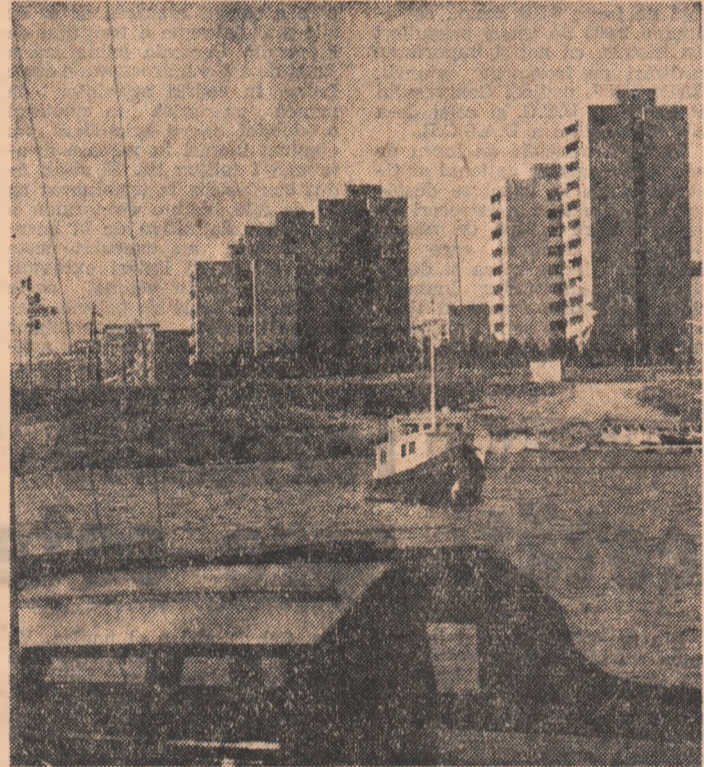
Un colț inedit al Constanței

Ar mai fi de menționat lipsa de operativitate a depozitelor de a prelua deșeurile metalice colectate. Activitatea este centralizată excesiv la sediul întreprinderii neglijindu-se punctele propriu-zise de colectare, care nu sînt dotate cu mijloace de transport corespunzătoare și nici cu utilaje de prelucrare mobile (în primul rînd prese). Măci cantități de deșuri metalice colectate de organizațiile U.T.C. așteaptă la exploatarea miniere din Valea Jiului. I. M. Barza, în satele Vaja de Jos, Toplița și altele să fie preluate dar depozitul nu poate face față cerințelor deoarece din 15 autocamioane funcționează doar 8, spațiile de depozitare sînt insuficiente, iar unele posturi chele (sarjatori) sînt vacante de mai multă vreme.