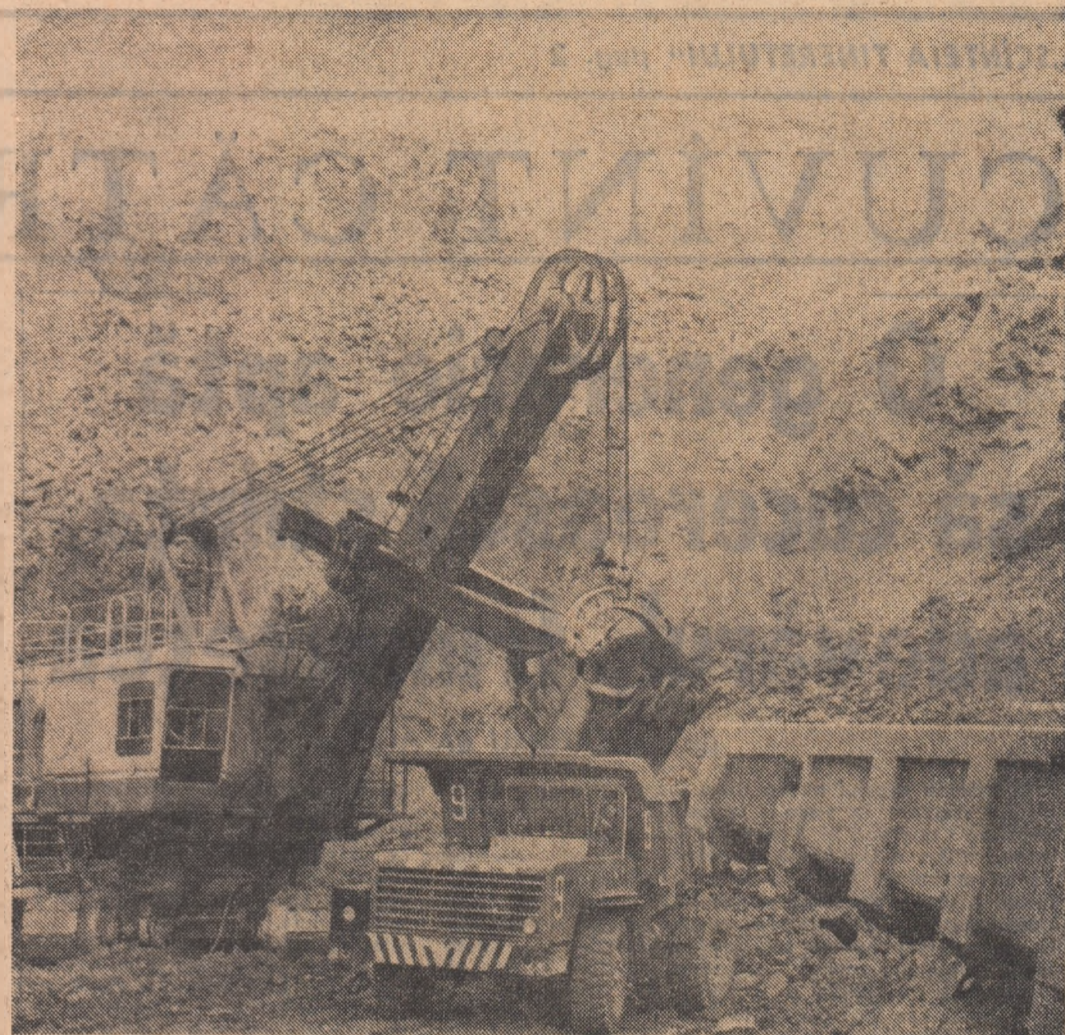
Oamenii mută muntele Pietricelu din Căliman — Vatra Dornei, lăsînd loc unei viitoare exploatare miniere la suprafață

EXPERIENȚE PE ADRESA NOULUI AN UNIVERSITAR