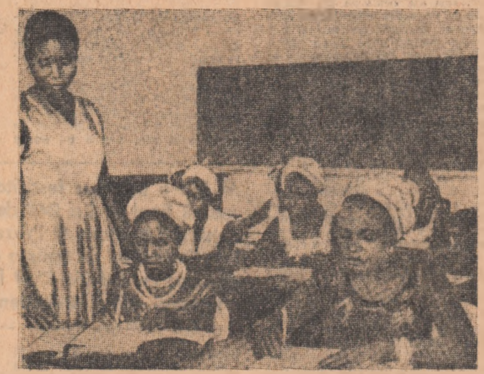
În SIERRA LEONE se depun eforturi pentru combaterea analfabetismului. În imagine, aspect din timpul unui curs de alfabetizare organizat în localitatea Engema

În aceeași zi, ambasadorul român a avut întrevederi cu ministrul de externe Ahmad Khalifa al-Suwaidi și cu dr. Maneh Sayed Al Oteiba, ministrul petrolului și resurselor minerale.