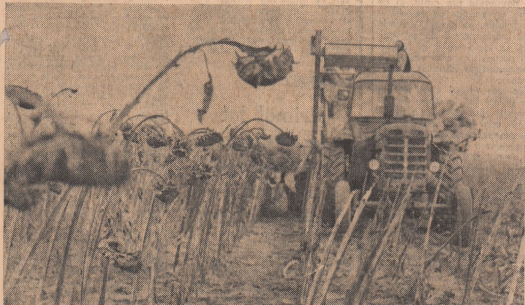
Recoltatul florii-soarelui se desfășoară din plin la C.A.P. Cobadin, județul Constanța