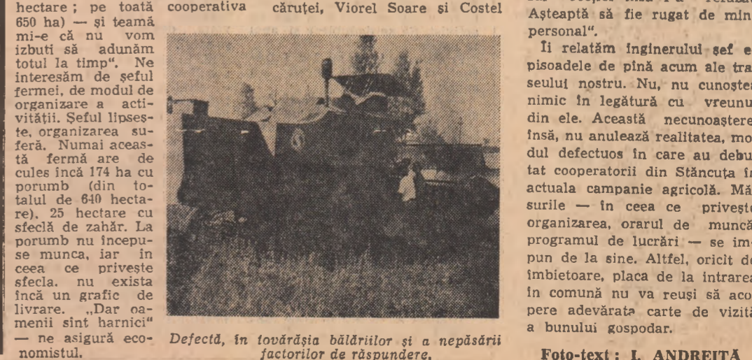
Defectă, în tovarășia bălărilor și a nepăsării factorilor de răspundere.

Asadar, în curînd constructorii termocentralei locuitorii actuali comune vor face ca pe harta județului Gorj să apară cel de al 6-lea oraș, orașul Turceni, care va avea o populație de 12.000 de locuitori, adică de 2 ori mai mulți decît azi. DAN VASILESCU