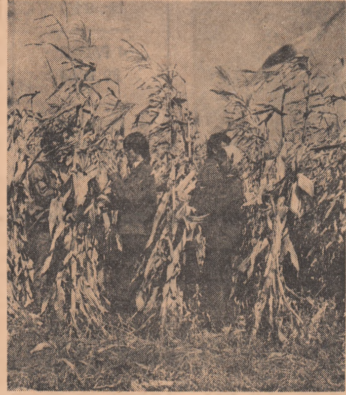
Stringerea recoltei de toamnă, sarcină prioritară a lucrătorilor din agricultură.