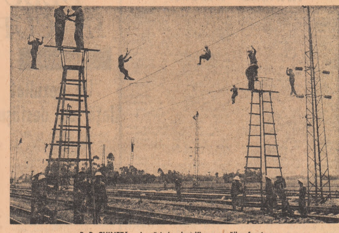
R. P. CHINEZĂ — Lucrări de electrificare a căilor ferate