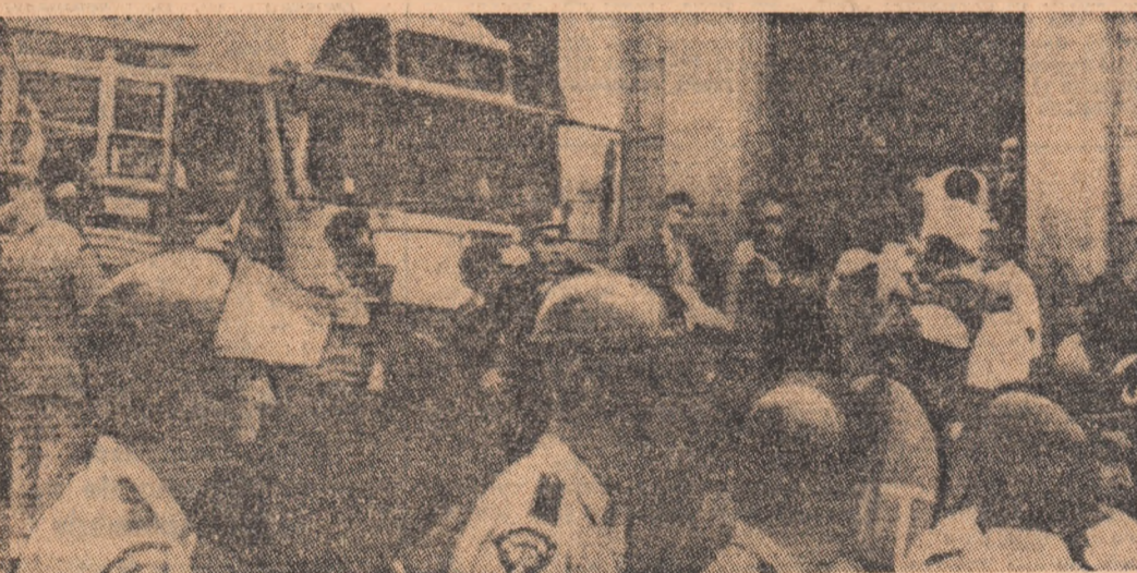
La Boston, Louisville și în alte orașe americane au avut loc incidente provocate de rasisti albi care se opun integrării rasiale în școli și transporturi în autobuz comune ale copiilor albi și negri.

La Tokio, imediat după sosirea sa de la Seul, Muriel Rukeyser, ea însăși poetă, a lansat un apel către opinia publică progresistă internațională să protesteze împotriva acestei noi samavolnicii a regimului lui Pak Cijun Hi.