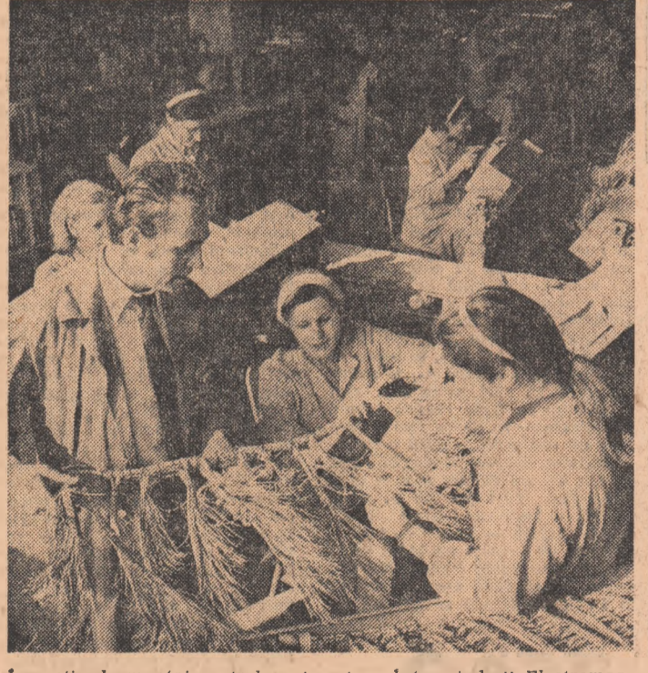
În secția de montaj centrale automate a Întreprinderii Electromagnetice din Capitală.