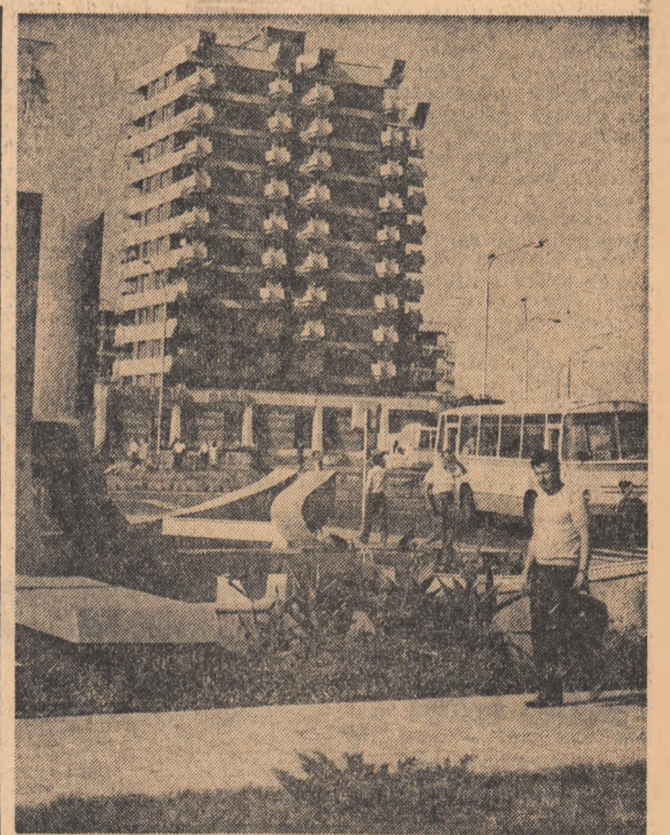
Vara prelungită la Craiova.