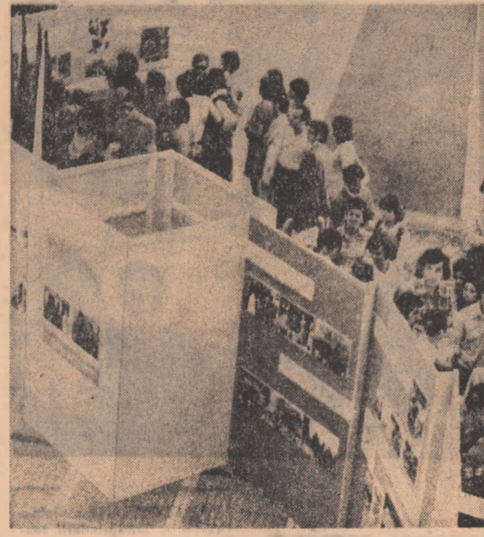
Aspect de la vernisajul expoziției de fotografii privind viața și activitatea tineretului cehoslovac.