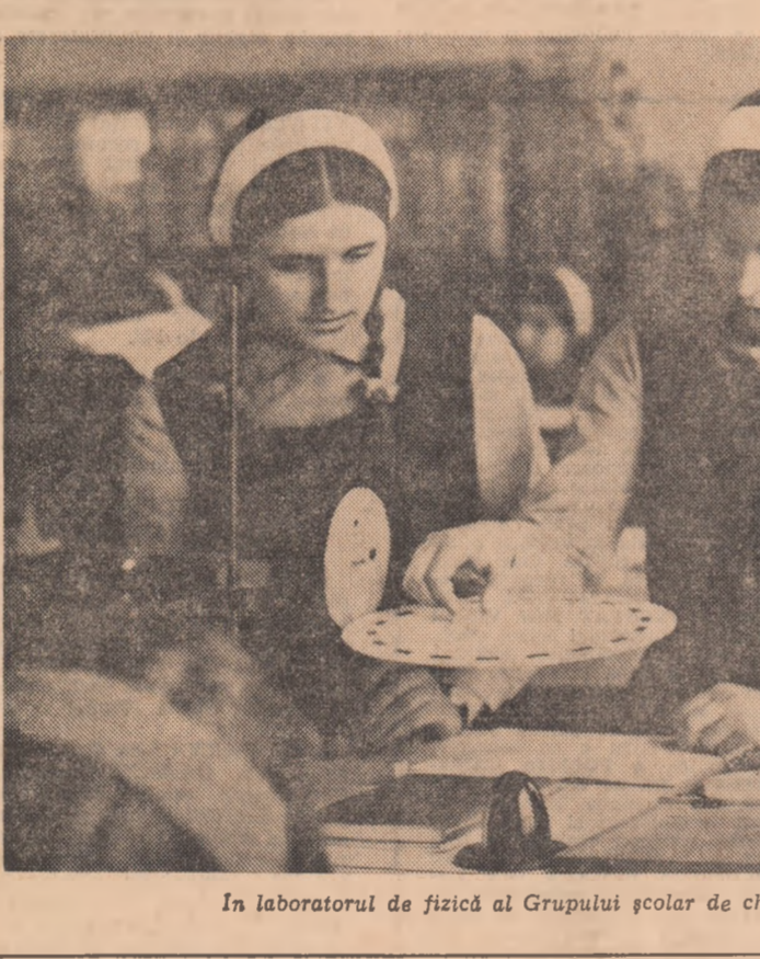
În laboratorul de fizică al Grupului școlar de chimie din Galați.