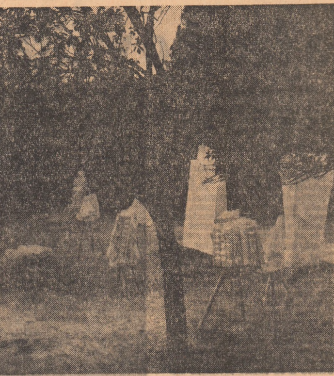
GEORGE APOSTU: „Compoziție”