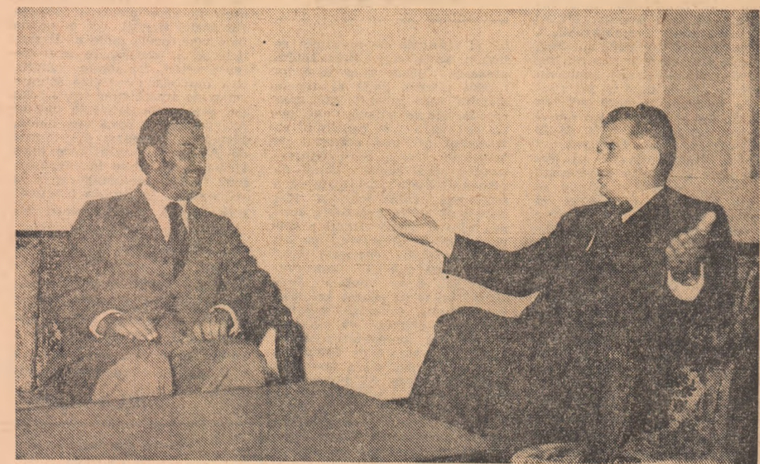
Ministrul finanțelor și economiei naționale din Sudan

Relatarea întrevederilor în pagina a 3-a