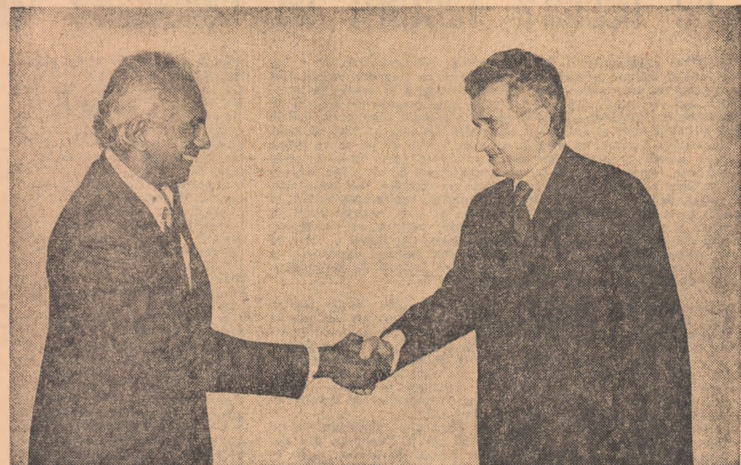
Președintele Camerei Comunelor, din Marea Britanie

Secretarul general al Partidului Progresist Popular din Republica Cooperatistă Guyana, Cheddi Jagan