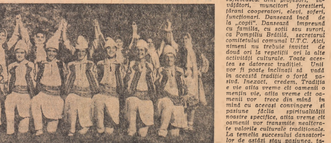
Ansamblul folcloric „Ciobănașul”