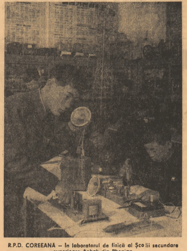
R.P.D. COREEANĂ — În laboratorul de fizică al Școlii secundare superioare Anhak din Phenian