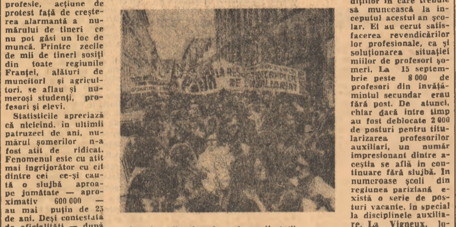
Imagine din timpul unei manifestații a cadrelor didactice, desfășurată recent la Paris pentru garantarea locurilor de muncă

Niciodată în Franța n-a mai fost organizată o manifestație atât de amplă pentru dreptul la muncă și la profesie al tinerilor. Astfel caracterizează o parte din presa franceză marea demonstrație care s-a desfășurat simbolic seara la Paris sub deviza „Tinerii vrea să trăiască”. Tinerii vor dreptul la muncă și la profesie, acțiune de protest față de creșterea alarmantă a numărului de tineri ce nu pot găsi un loc de muncă. Printre cele de muncă de tineri sînt din toate regiunile Franței, alături de muncitorii și agricultorii, se află și numeroși studenți, profesori și elevi.