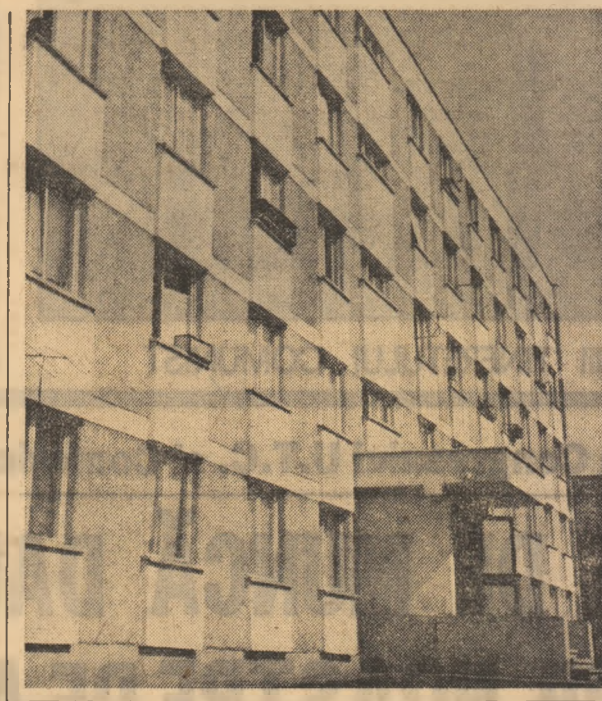
Căminul pentru nefamiliați din cartierul Dărmănești, din Piața Neamț.

Un șantier a cărui cotă zero a și fost depășită, dotat cu utilități moderne, ale cărui lucrări sînt îndeplinite de un număr minime de muncitori și tehnicieni — 28 — este condus de un tânăr inginer stagiar, care și-a predat lucrarea de diplomă abia cu 3 luni în urmă, Mihai Popovici.