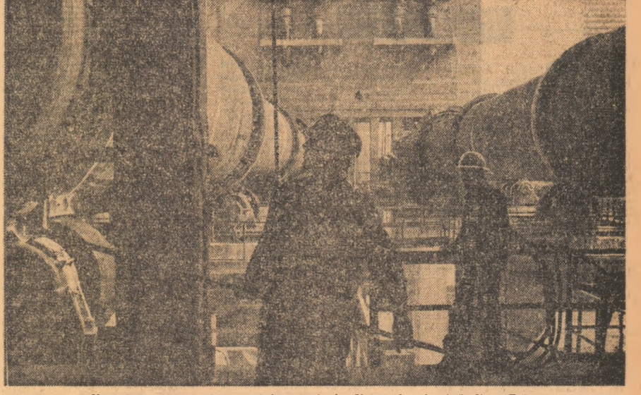
Una din construcțiile actualului cincinal: Uzina de aluminiu din Tulcea.