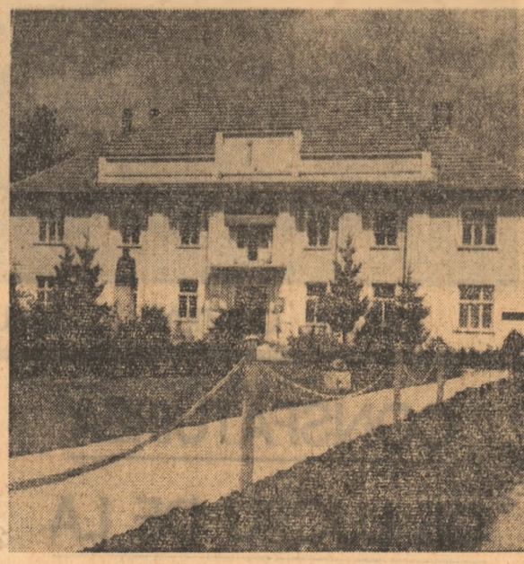
Casa de cultura din Covasna