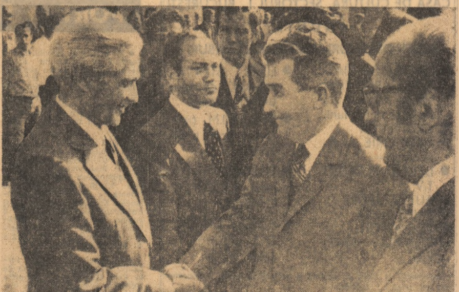
Întâlnire cu secretarul general al P.C. Portughez, Alvaro Cunhal