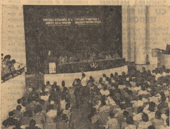
Un eveniment de mare rezonanță: Conferința internațională a tineretului pe problemele populației

Întreaga activitate internațională a U.T.C. și U.A.S.C.R. s-a desfășurat pe platforma unitii eforturilor tinerilor și organizațiilor lor de diverse orientări și tendinșe politice, filozofice și religioase, pentru sporirea contribuției tineretului progresist al lumii la soluționarea problemelor majore care confruntă contemporaneitatea, pentru a asigura tinerei generații condiții din ce în ce mai favorabile spre a munci și trăi, spre a se afirma într-o lume în care să-și găsească împlinire aspirațiile sale cele mai aumpe.