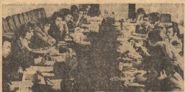
Aspect de la lucrările seminarului bilateral U.A.S.C.R. — I.S.M.U.N.

Au continuat să se dezvolte relațiile de solidaritate militantă și sinceră prietenie cu organizațiile comuniste și revoluționare de tineret din întreaga lume. O evoluție ascendentă au cunoscut raporturile cu organizațiile tineretului comunist din Franța, R. F. Germania, Italia, Portugalia, țările nordice, Grecia, Elveția, Japonia, Peru, Panama, Chile etc., cu care au avut loc schimburi de delegații, de informații, diverse consultări și contacte.