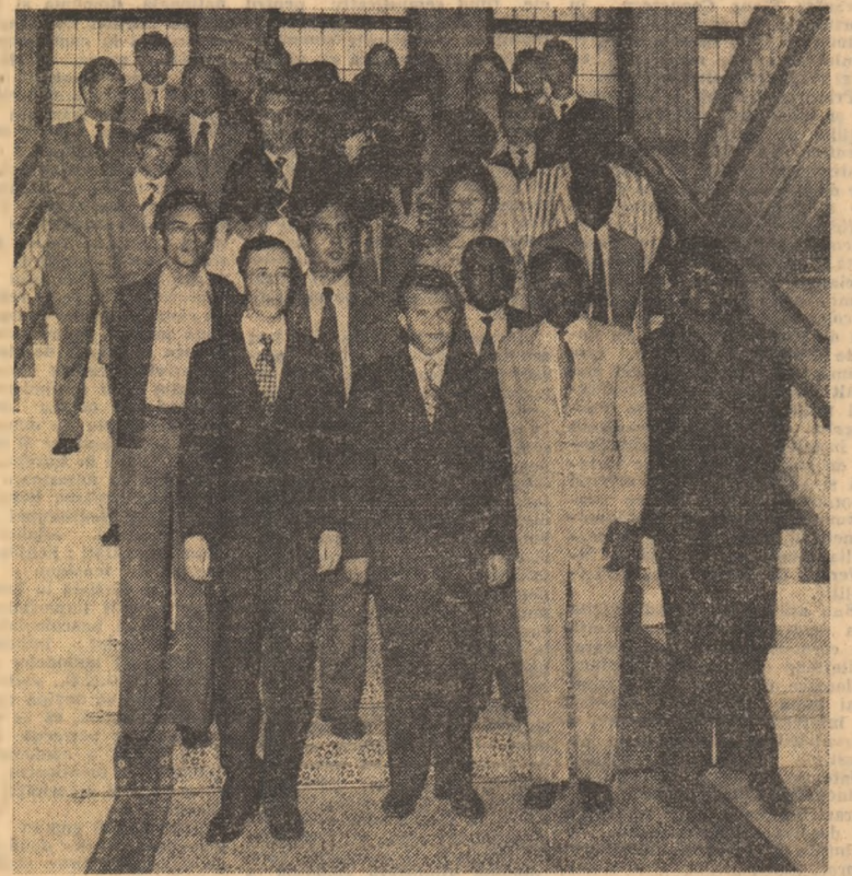
Tovarășul Nicolae Ceaușescu primind pe participanții la Seminarul organizat de Uniunea Tineretului Comunist și Mișcarea Panafricană a Tineretului

Care este locul tineretului universitar, în această lume? După părerea mea, locul său este alături de masa largă populară, alături de masele largi populare, să contribuie la unirea tuturor forțelor pentru a lichida definitiv vechea orientare în politica internațională, vechile practici în raporturile dintre state și pentru a asigura relațiile internaționale pe baze noi. Tineretul — atât cel muncitoresc, țărănesc, cit și intelectual, deci și tineretul de pe băncile universităților — este chemat să fie unul din factorii cei mai activi în realizarea acestei noi politici în viața internațională. Cei care astăzi se află pe băncile universităților se preocupă de însușirea științei și culturii — care, pînă la urmă, nu au granițe — și trebuie să facem