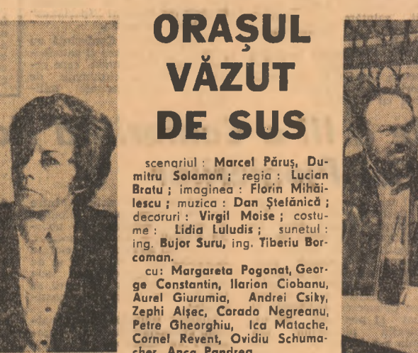
Film realizat în studiourile Centrului de Producție Cinematografică „București”