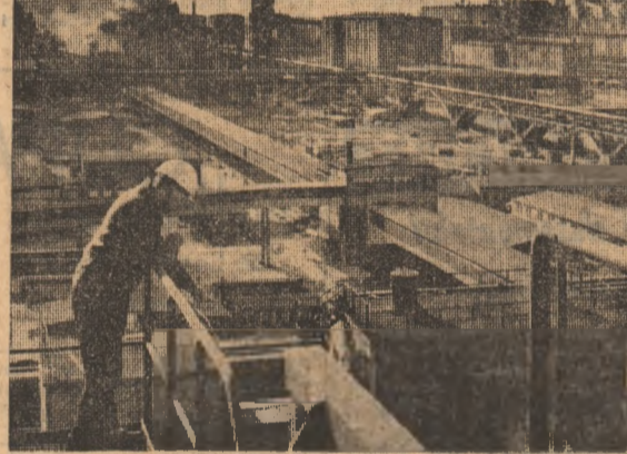
R.D. GERMANIA — Vederea a Combinatului Schwarze Pumpe din Hoya, Germania.