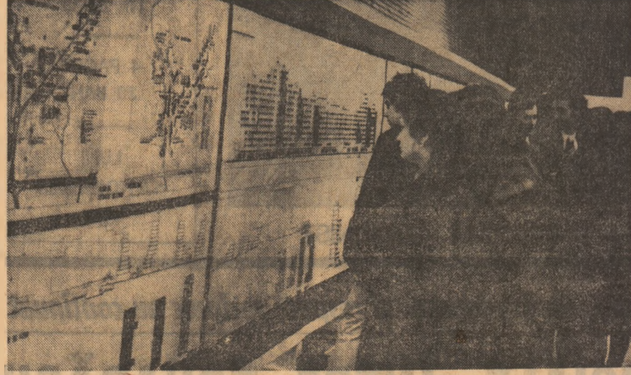
Expoziția de creație științifică a studenților bucureșteni Argument pentru valorificarea în producție

forțe se va înregistra în livada pomicoasă unde, concomitent cu fertilizarea, se vor desfășura lucrările de săpare a gropilor, pentru îndesirea și modernizarea plantațiilor, așa cum a recomandat recent tovarășul Nicolae Ceaușescu.