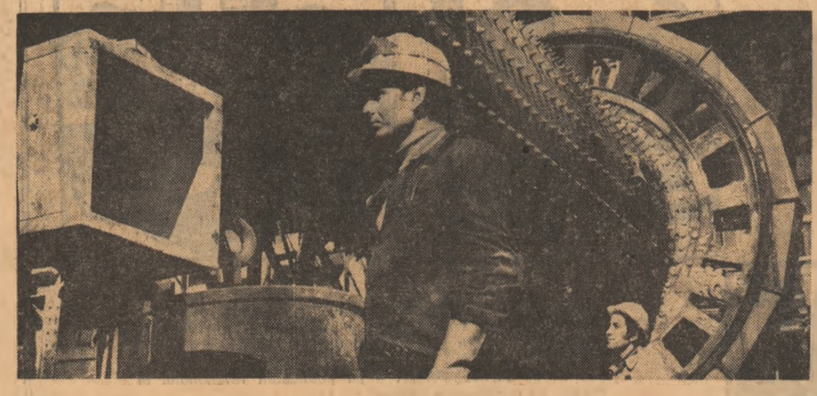
Secția măcinare de la Întreprinderea de aluminiă din Tulcea.

permanență a conducerii partidului pentru dezvoltarea economică și socială a județului, de sprijinul prețios acordat de tovarășul Nicolae Ceaușescu, în anii cincinalului numărul locuitorilor de muncă nou creați a sporit cu 10.500, au fost date în folosință 9.800 apartamente, noi, 5.650 case noi, 3.100 locuri în cămine pentru nefamilisti, 200 săli de clasă, 2.135 locuri în creșe și grădinițe, pe harta județului au apărut numeroase noi obiective social-culturale, iar veniturile bănești ale populației din sectorul socialist au crescut cu 32,9 la sută în anul 1974 comparativ cu 1970.