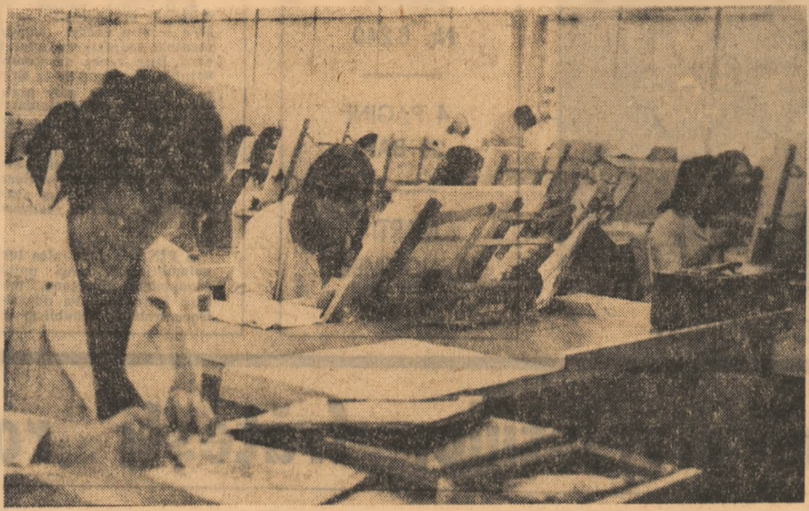
Intra-una din secțiile întreprinderii de calculatoare din București