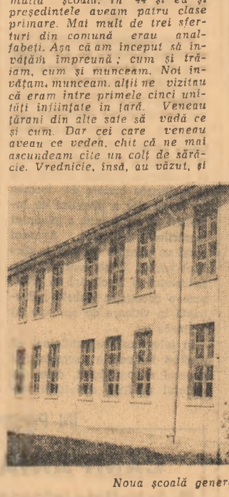
Noua școală generală din Sinești

● A intrat în probe de sanitar instalatia de foraj F-500, care poate fi considerată utilitat „numărul 1” ca marime printre instalatiile românești de acest fel. Totodată se este totaia cea mai distrele mai mari din lume. ● La I.P.R. au fost elaborate o serie de elemente și sisteme de automatizare moderne pentru reglarea proceselor tehnologice lente. ● În U.R.S.S. se studiază un proiect privind construirea unui canal lung de 2.500 km. Scopul? Să orienteze cursul unor dintre apele Siberiei către stelele și de-erturile din Asia Centrală. ● 396,5 km pe oră. Acesta este noul record mondial de viteză pe cale ferată în S.U.A. Locomotiva este pusă în mi-care de un motor electric cu inducție și de două motoare cu reacție. Astfel a fost depășit recordul pe care îl dețineau francezii din 1953 și care era de 331 km pe oră. ● Problema poluării mării poate fi combătută după părerea unor savanți chiar pe cale biolo-