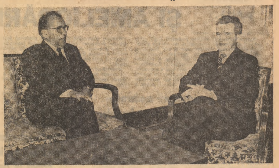
Tovarășul Nicolae Ceaușescu, secretar general al Partidului Comunist Român, s-a întâlnit, în ziua de 4 decembrie, cu tovarășul Santiago Carrillo...